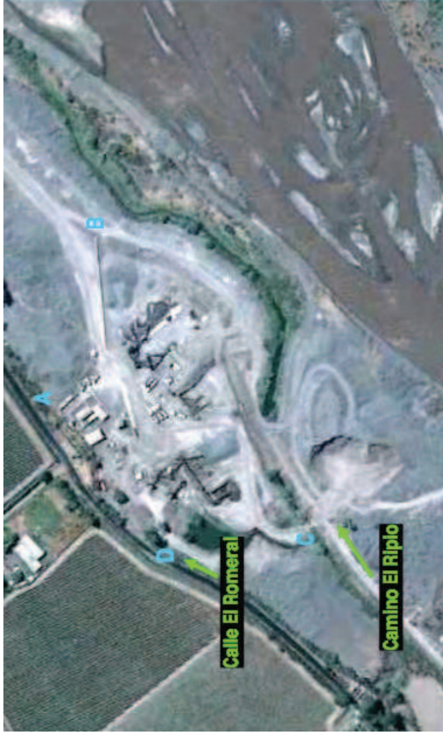
Figura 3-1: Emplazamiento del Proyecto