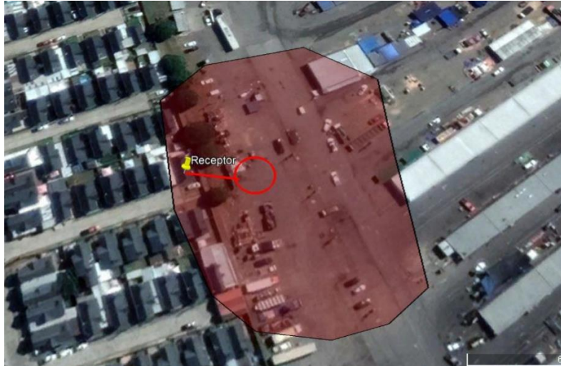
Imagen N°2 Zona de mayor ruido con respecto a receptor