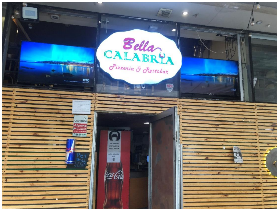
Dos televisores conectados a internet con música envasada.