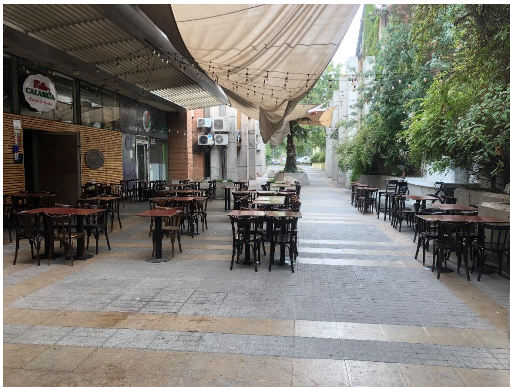
Terraza de 14x 13 mt. aproximadamente