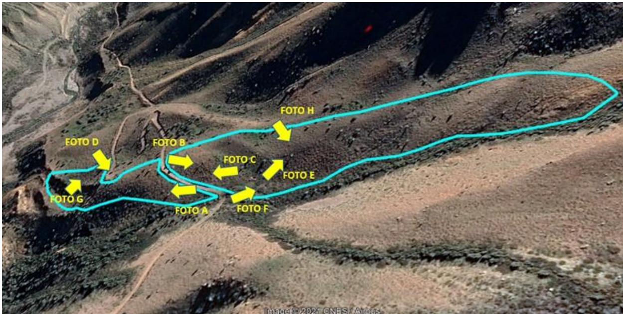
Figura 2. Área de enriquecimiento vegetacional - zona alta y zona baja antes del retiro

A continuación, se muestran Fotografías fechadas y georreferenciadas del sector antes del retiro, donde se observan materiales a retirar.