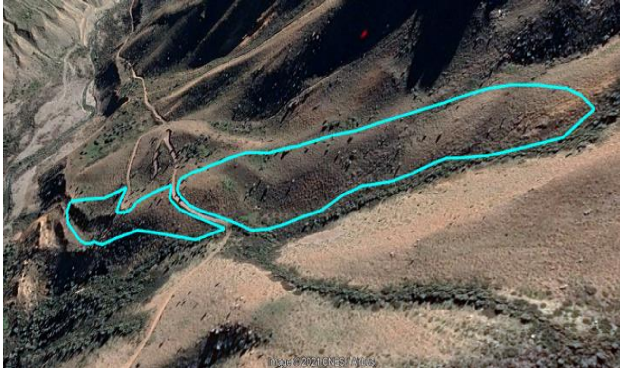
Figura 1 Área de enriquecimiento vegetacional - zona alta y zona baja