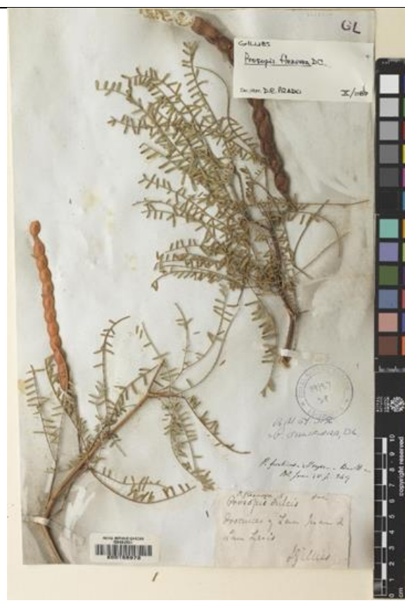
Prosopis flexuosa DC, Muestra del Herbario Royal Botánica Garden Edimburgh. Colectada en la prov. De San Luis. República Argentina.