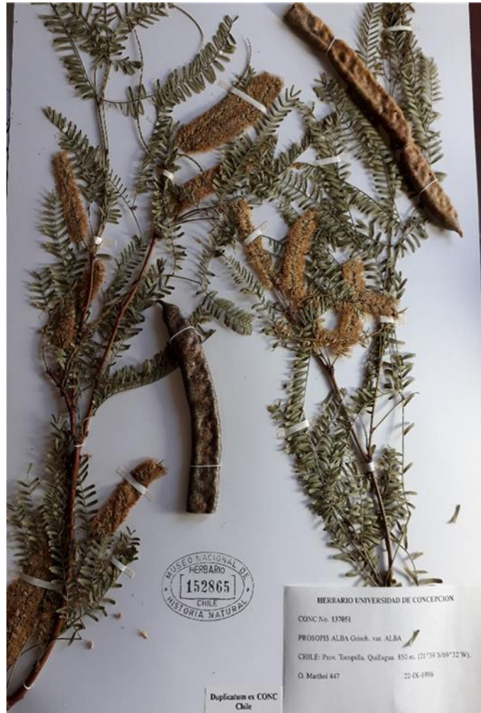
Prosopis alba Griseb. Ejemplar 152865 del Herbario SGO del Museo Nacional de Historia Natural, colectado en Quillagua, Región de Antofagasta.

Prosopis alba Griseb. nativa de zonas áridas de Chile, Bolivia; Perú, Argentina, Paraguay; constituye una especie arbórea pionera, heliófila, adaptada a condiciones de climas áridos y semiáridos con suelos salinos y degradados, es considerada rústica, tiene una gran plasticidad, y soporta condiciones extremas de humedad y temperatura (Galera, 2000, Bessega et al., 2018).