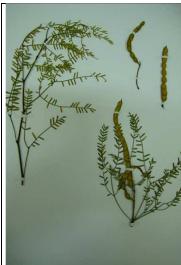
Prosopis flexuosa DC, en Ficha de Antecedentes de la especie presentada al Noveno Proceso de Clasificación de Especies según RCE (2012). Sin datos de colecta. ( https://clasificacionespecies.mma.gob.cl/wp-content/uploads/2019/10/Prosopis_flexuosa.pdf )

Así mismo presentan alta similitud morfológica y pueden presentar distribuciones parcialmente superpuestas (Palacios & Bravo, 1981, Joseau et al 2005). P. flexuosa , P. alba y P. chilensis constituyen un grupo de especies que hibridan y se comportan como un complejo de especies que se mantiene aislado reproductivamente de otros grupos similares (Joseau et al. 2005)