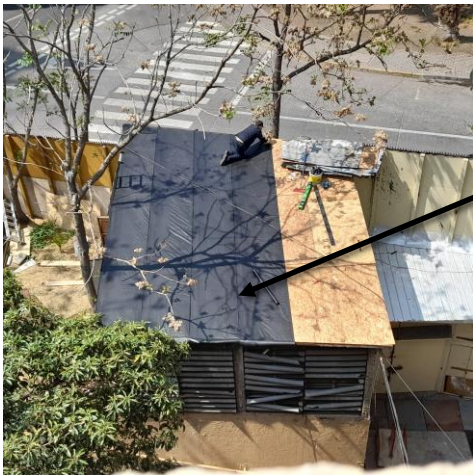
3. Colocación de fieltro negro