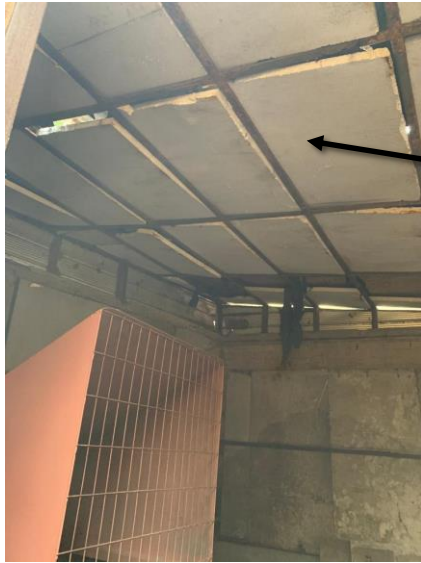
1. Colocación de aislación en el interior en la torre