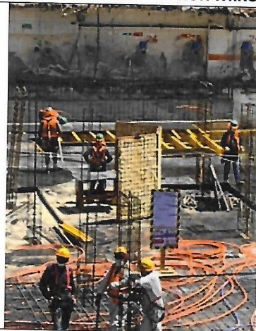
Fotografía 3: Encierro Acústico Faenas de Corte