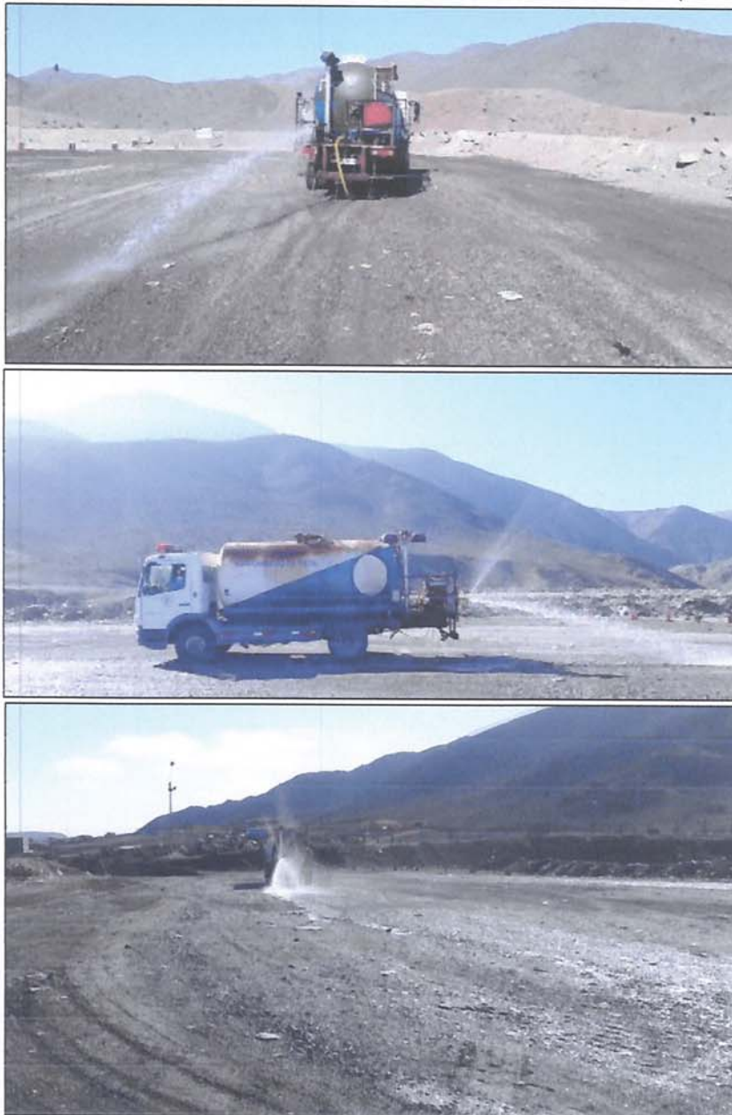
Figura 3.4.1. Actividades de Regadío de la Vialidad Interior del Vertedero Municipal

En cuanto a la infracción N° 6, presentada por parte del Proceso Infraccionario ROL F-044-2020, cabe de informar que se han estado realizando los regadíos al interior de la vialidad interior del VERTEDERO MUNICIPAL DE TALTAL , en función de lo estipulado en la Resolución de Calificación Ambiental N° 120/2004 , y por defecto a la Declaración de Impacto Ambiental (DIA), correspondiente al proyecto.