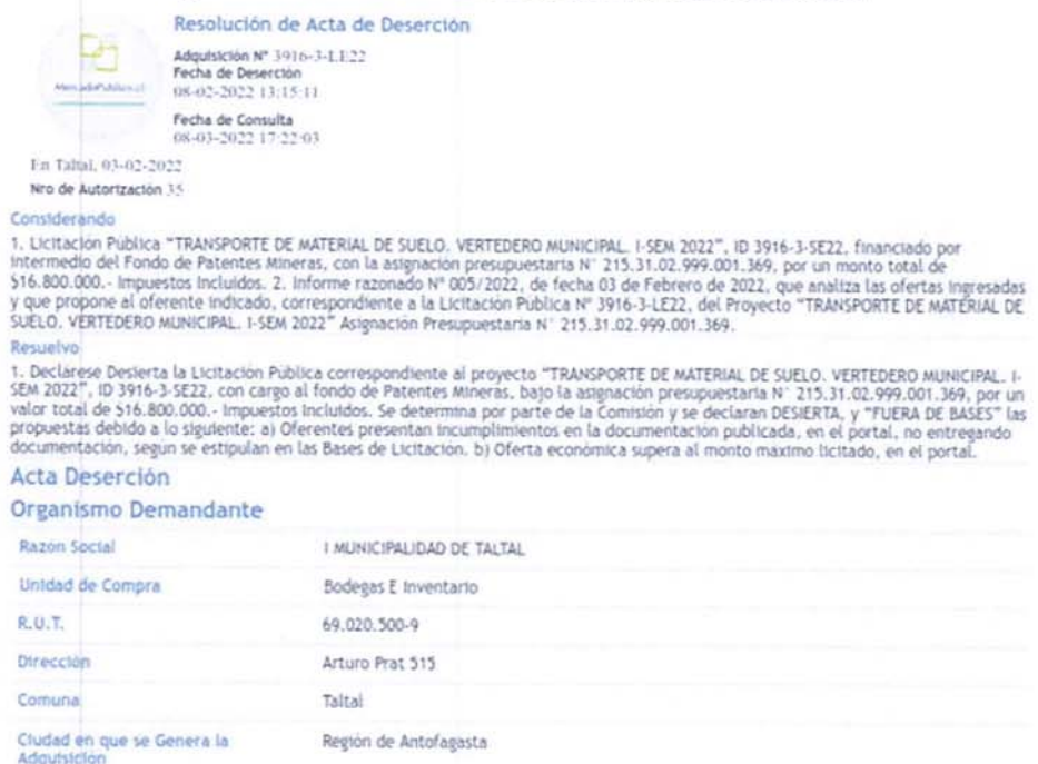
Figura N°3.1.3.1. Extracto Acta de Deserción Licitación ID 3916-3-LE22.