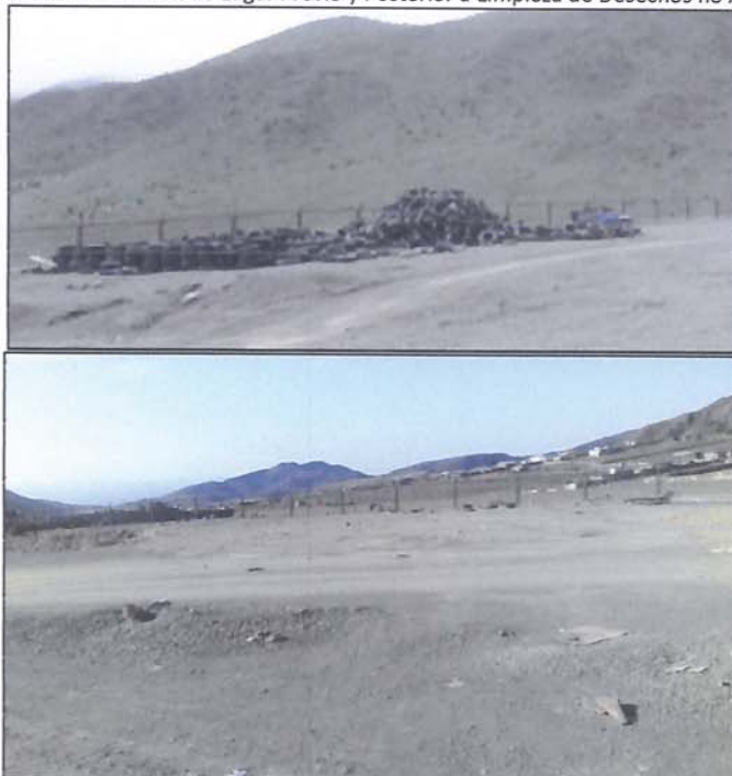
Figura N° 3.1.2.1.. Evolución de Lugar Previo y Posterior a Limpieza de Desechos no Asimilables

Fuente. Secretaría Comunal de Planificación