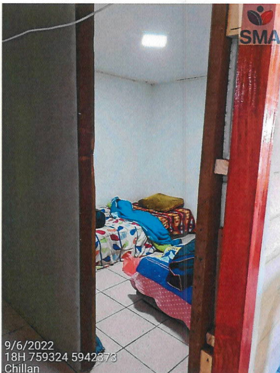
Foto 8 Dormitorio Interior