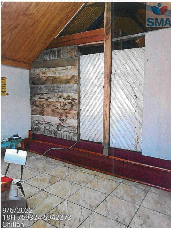
Foto 4 Dormitorio interior