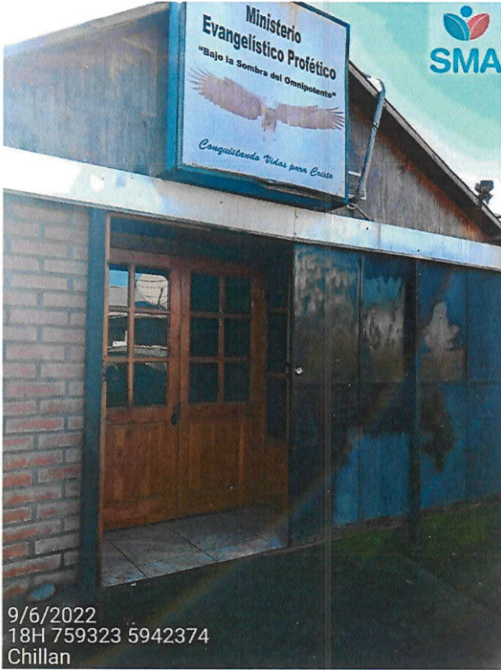
Foto 2 Comedor habilitado