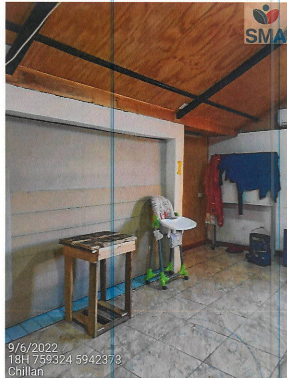
Foto 7 Dormitorio interior