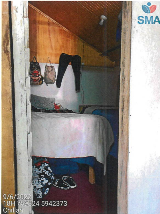
Foto 6 Area de transito