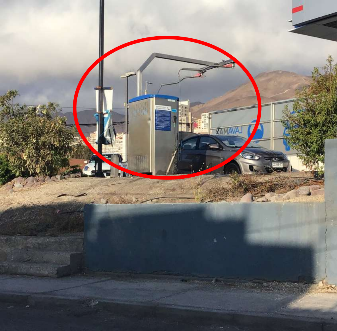
Máquina lavadora de autos