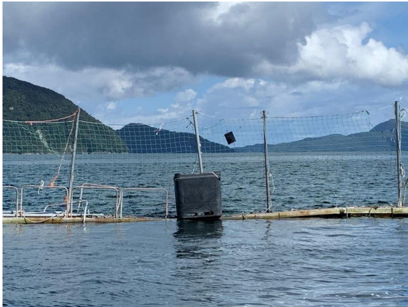
Figura N°2: Bins con mortalidad, sobre el pasillo lateral de jaula 9.