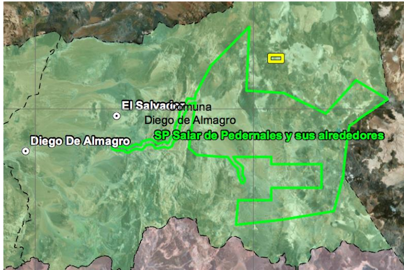
Figura N° 2 Ubicación del Proyecto en relación con el Sitio Prioritario “Salar de Pedernales y sus alrededores”