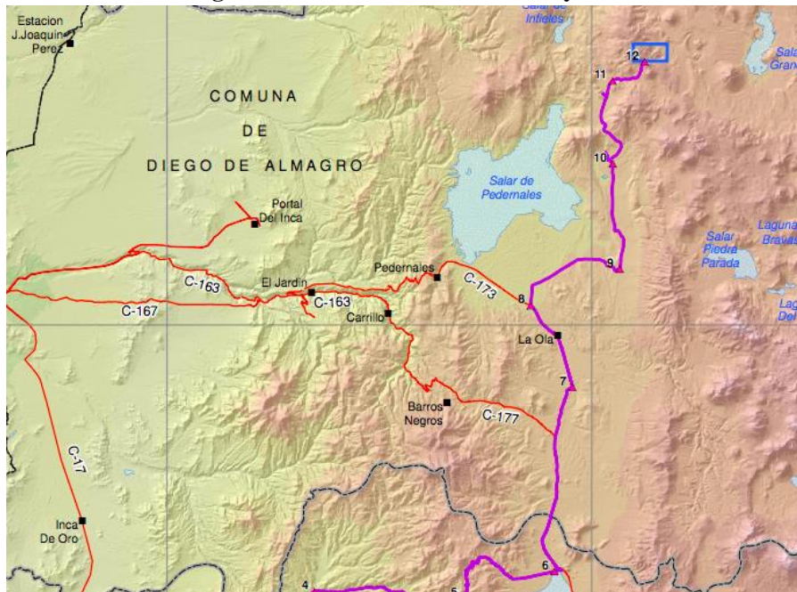
Figura N° 3 Rutas de Acceso al Proyecto