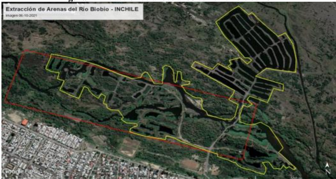
Figura 7: Extracción de áridos al 06 de noviembre de 2021