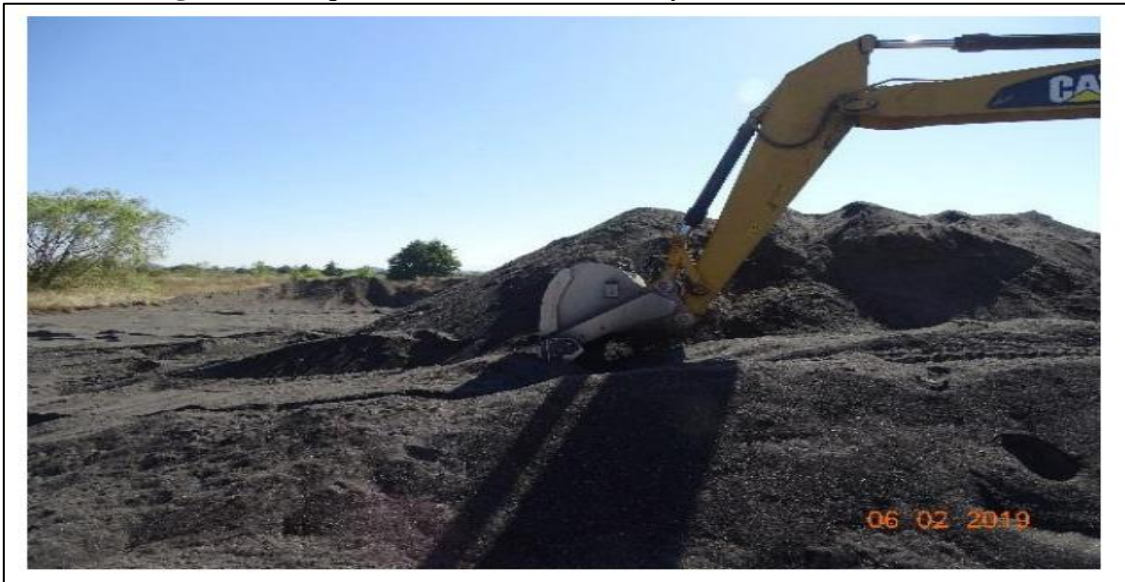
Figura 4: Máquina excavadora detenida y material de arena extraído.