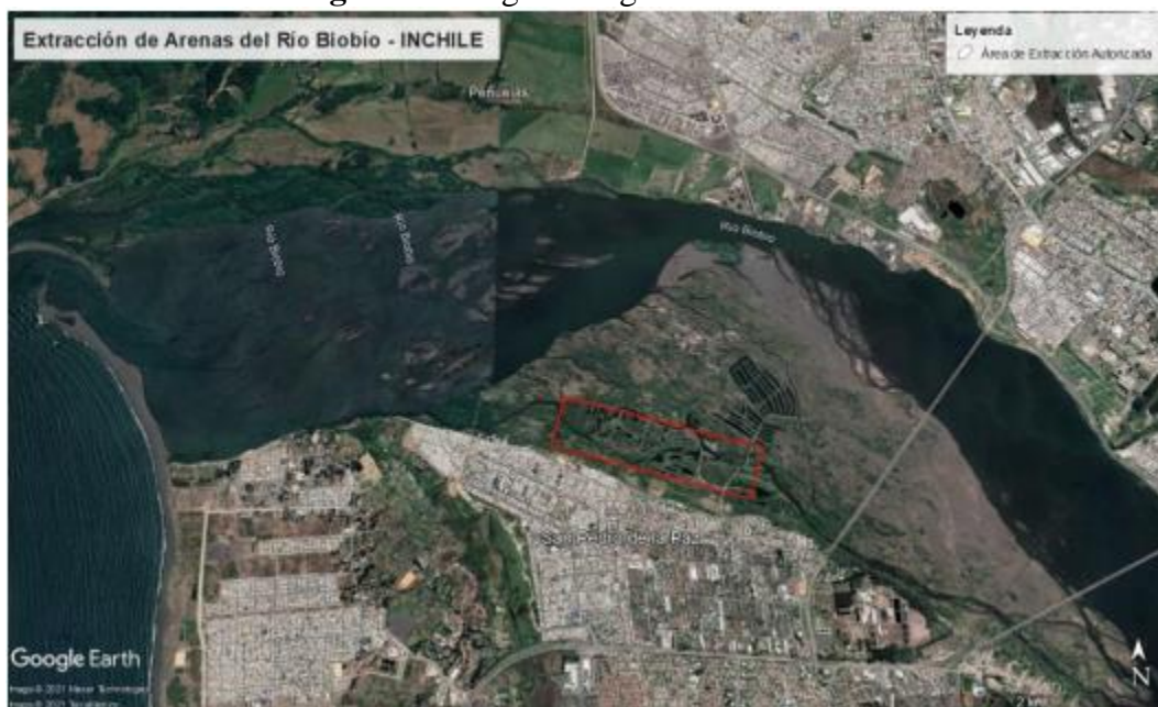
Figura 5: Polígono original de extracción