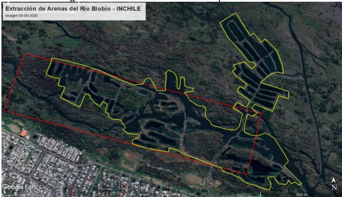
Figura 6: Extracción de áridos al 05 de septiembre de 2020