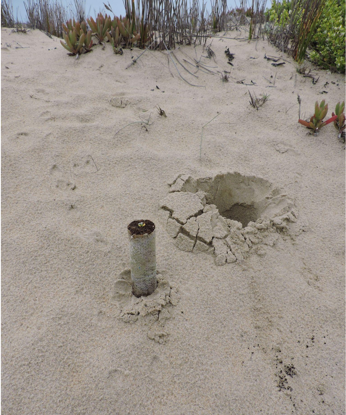
Fig. 2. Plantación de ejemplar de A. trifoliatum de vivero.

Con el consejo del profesor don Carlos Medina Labarca y junto a una atenta observación del medio, se tuvo en cuenta la disponibilidad de humedad edáfica hacia la periferia de los montículos de duna primaria. Se plantaron 7 ejemplares de vivero (Fig. 2).