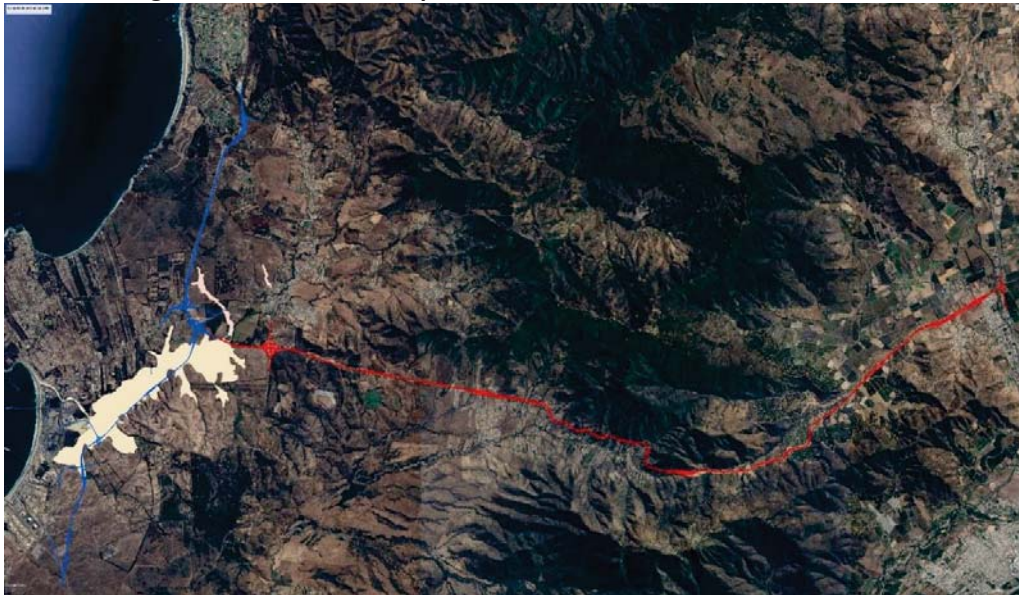
Figura 2. KMZ consulta de pertinencia con KMZ de humedales urbanos