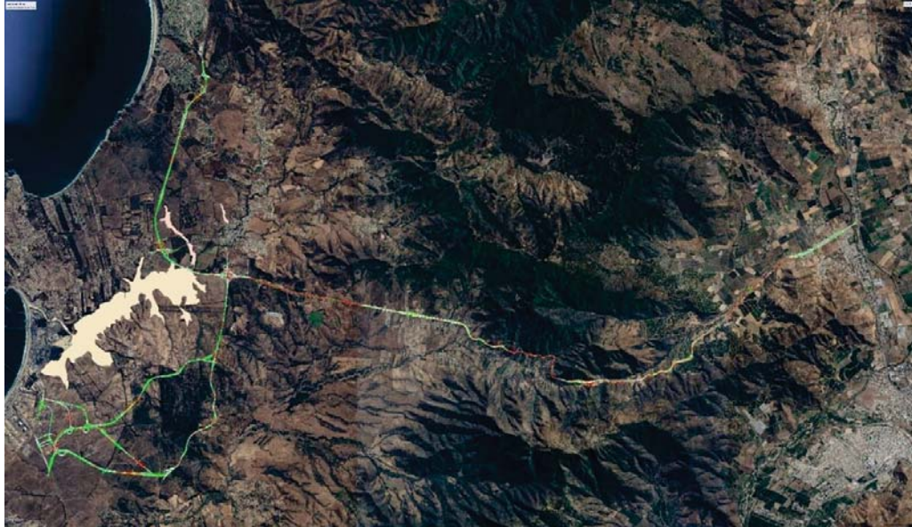
Figura 4. KMZ proyecto actual (modificaciones Sector 1 (Ruta F-20), Sector 2 (By Pass a Ruta F-30E) y Sector 3 (Variante Ventanas) con KMZ de humedales urbanos