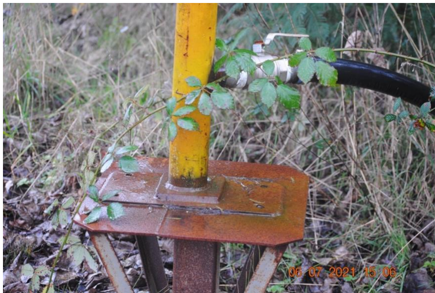
Registro Fotográfico N°6. Bocatoma no autorizada en río Cruces.