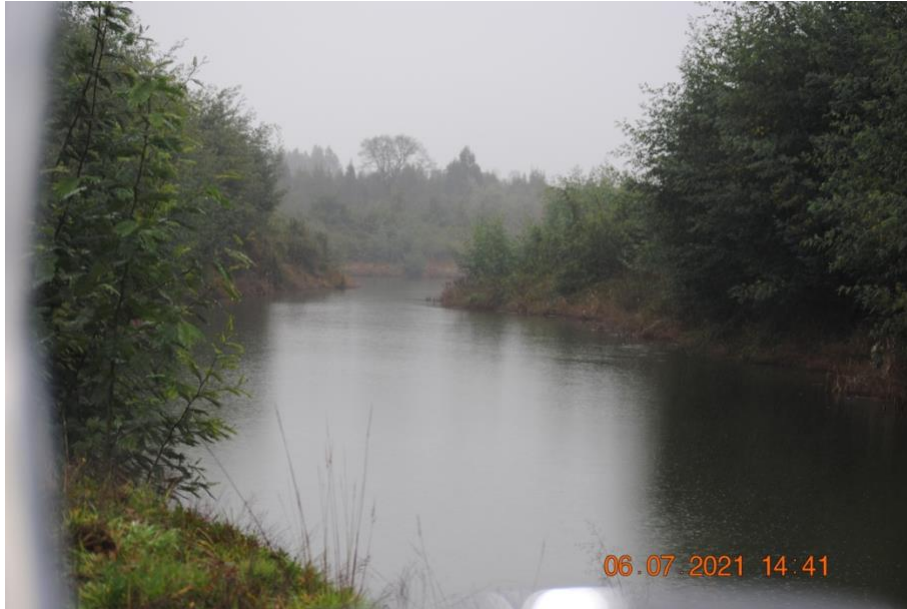
Registro Fotográfico N°8. Lagunas de gran extensión.