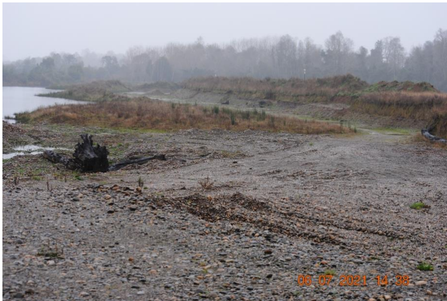
Registro Fotográfico N°1. Corta de árboles nativos.

A continuación se muestra un registro fotográfico: