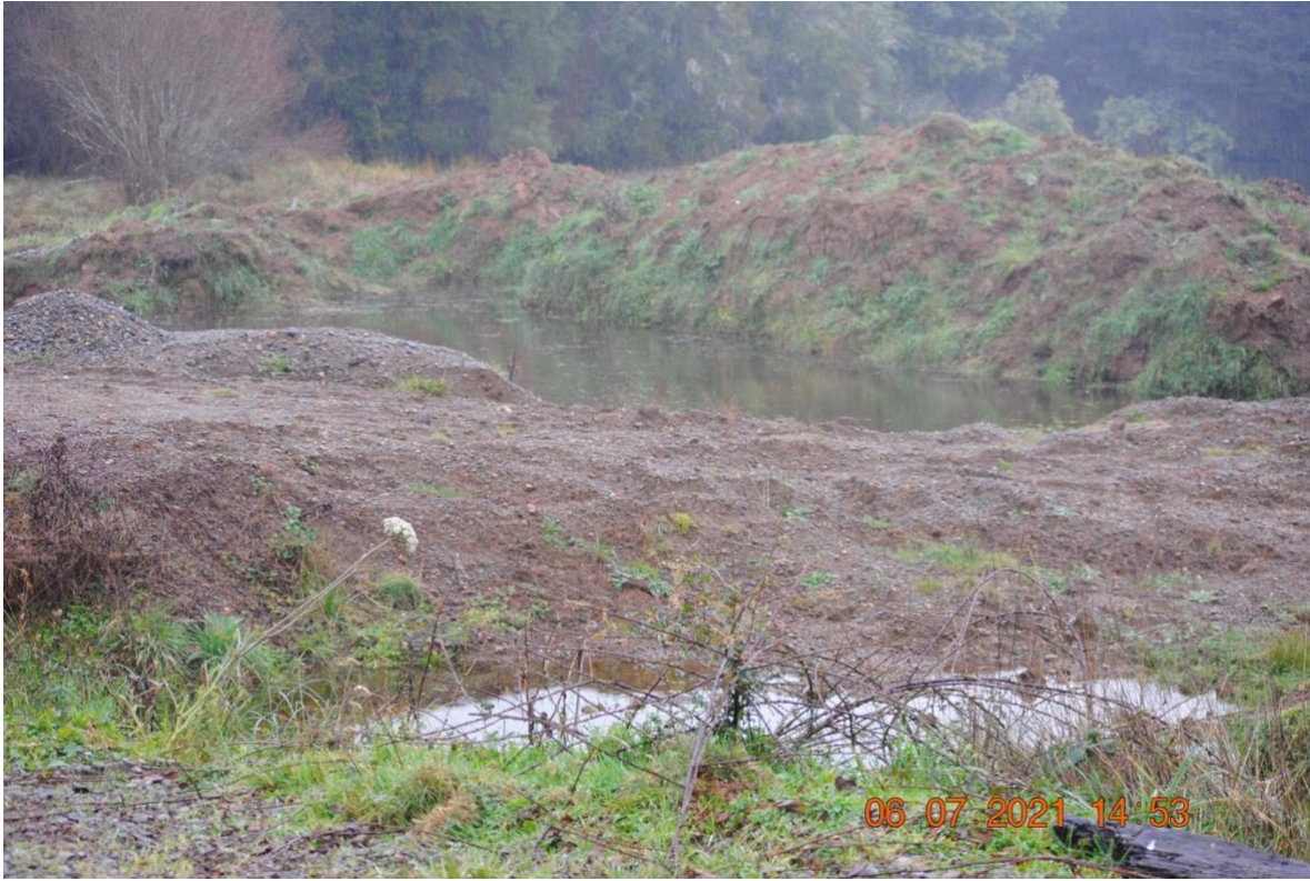
Registro Fotográfico N°4. Eliminación capa vegetal en suelos no autorizados.