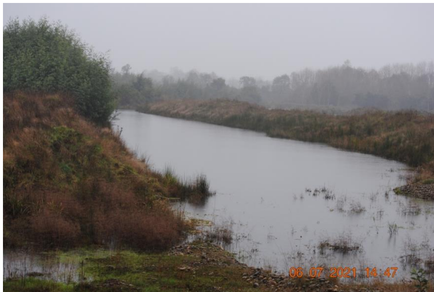
Registro Fotográfico N°7. Lagunas de gran extensión.

A continuación se muestra un registro fotográfico: