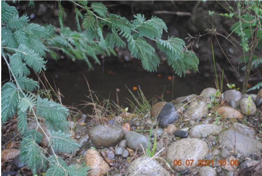
Registro Fotográfico N°5. Bocatoma no autorizada en río Cruces.