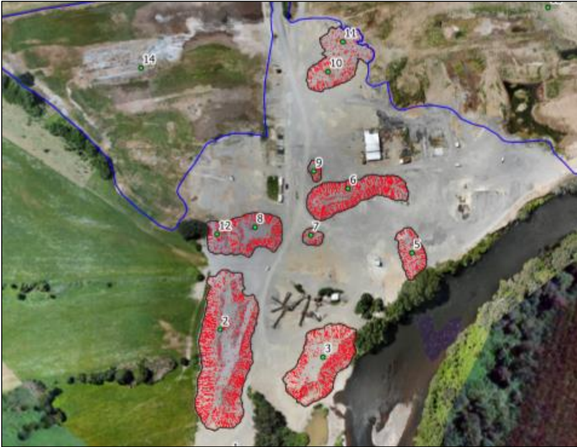
Imagen N°1: Sitios de acopio de material