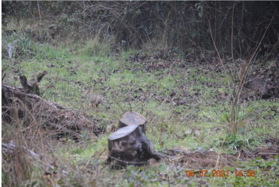
Registro Fotográfico N°2. Corta de árboles nativos.