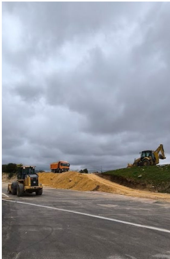
Proceso de levantamiento de la altura de talud en el sector aledaño a la calle Juan Alvarado Rojas