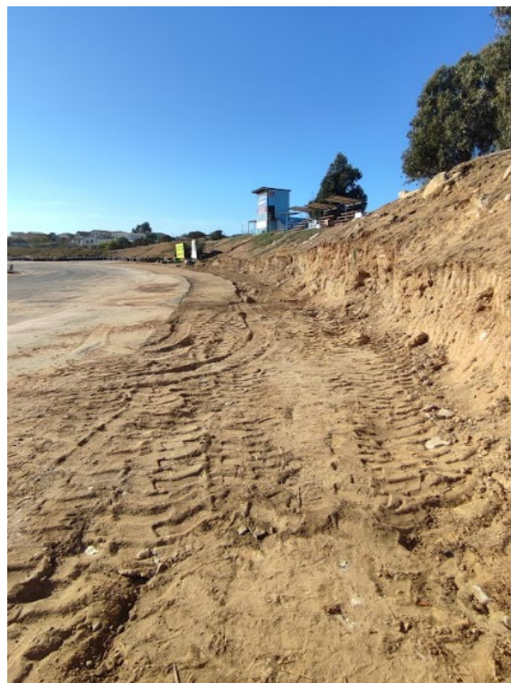
Inicio del levantamiento de la altura del talud hacia el sector aledaño a la calle Juan Alvarado Rojas