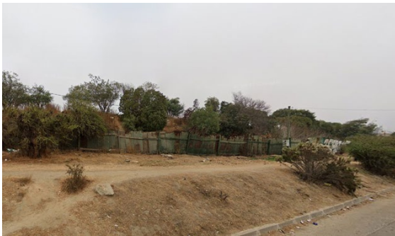
Vista del límite oriente del autódromo desde la calle Juan Alvarado Rojas (abril de 2023)