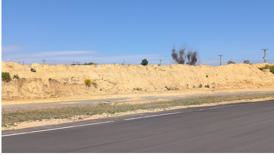
Aumento de la altura del talud hacia calle Juan Alvarado Rojas