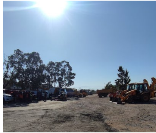
Vista hacia el otro sector del estacionamiento hacia la calle Anita Lizana (sin talud)