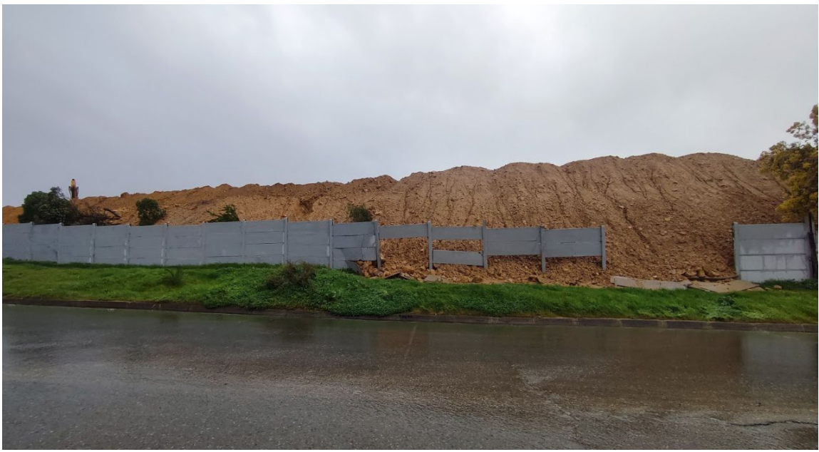
Vista desde la calle Juan Alvarado Rojas de la elevación de la altura de talud

109. Además, entre los meses de agosto y septiembre de 2024, se han instalado paneles en la entrada principal y en el acceso N° 2 del CADQ. En estos se ha instalado un panel de construcción llamado SIP, consistente en un panel estructural y térmico formado por dos placas de madera OSB y un núcleo de poliestireno expandido (EPS) de alta densidad que no solo tiene la ventaja de ser un sistema de construcción rápido, con propiedades de aislamiento térmico y acústico, sino que también su densidad sobrepasa los 10Kg/m 2 .