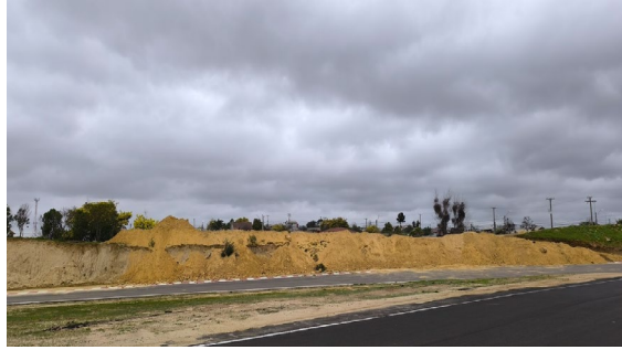
Proceso de levantamiento de la altura de talud en el sector aledaño a la calle Juan Alvarado Rojas