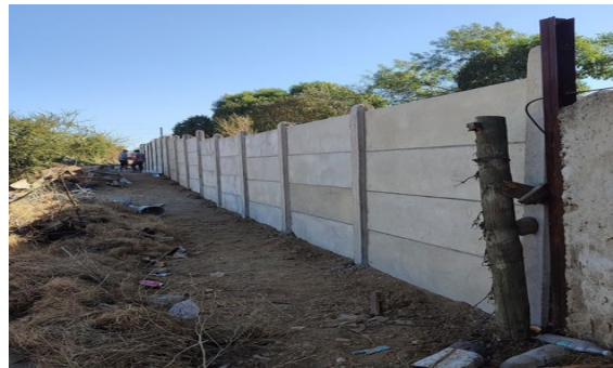
Vista del límite oriente del autódromo desde la calle Juan Alvarado Rojas (febrero de 2024)