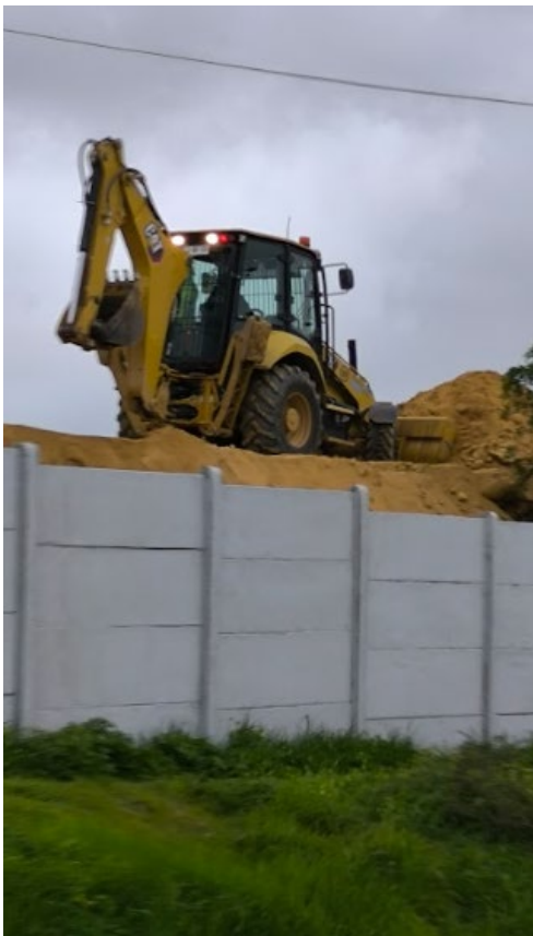
Proceso de levantamiento de la altura de talud en el sector aledaño a la calle Juan Alvarado Rojas