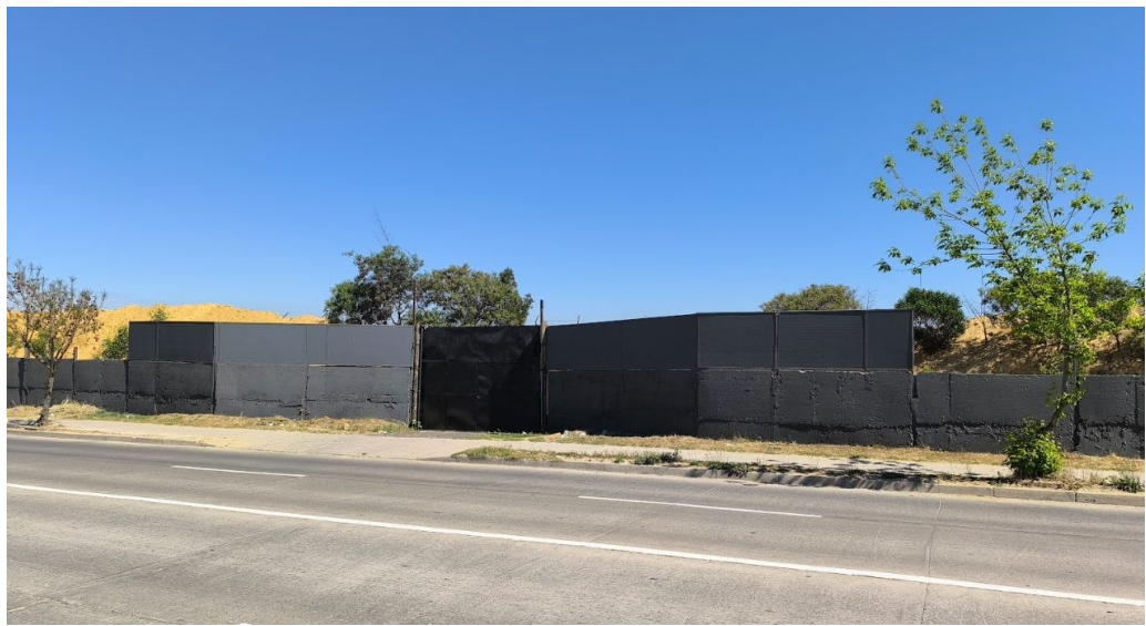
Instalación de barrera acústica en el portón de acceso N° 2 del CADQ