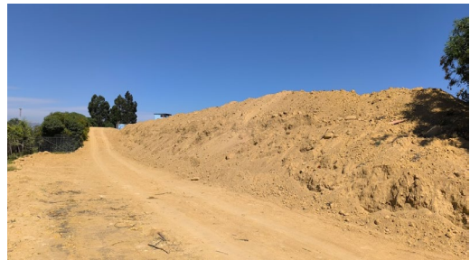
Proceso de levantamiento de talud hacia calle Anita Lizana