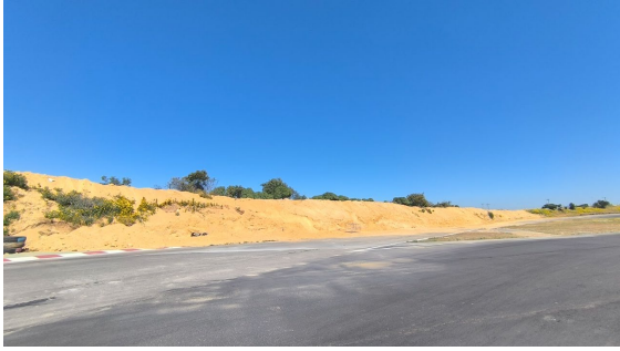
Proceso de levantamiento de la altura de talud en el sector aledaño a la calle Juan Alvarado Rojas