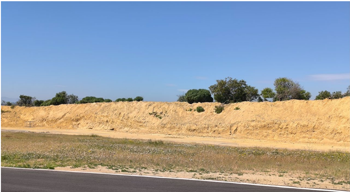
Vista desde la pista de aumento de la altura de talud hacia la calle Juan Alvarado Rojas