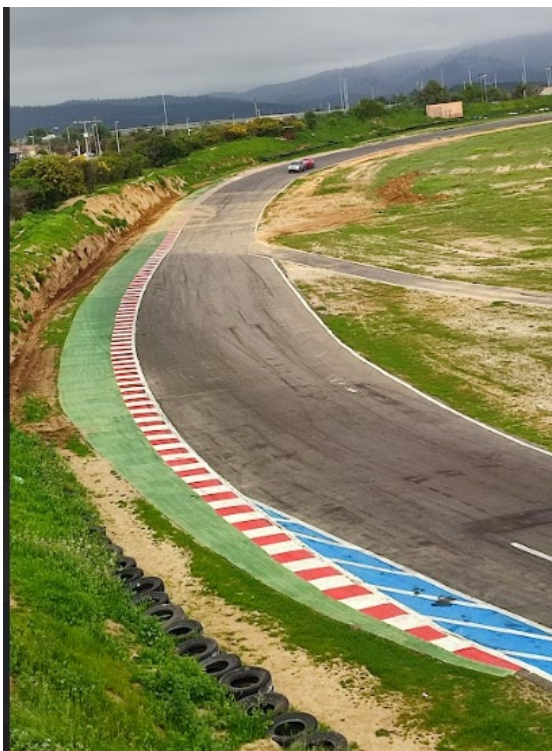
Vista hacia la calle Juan Alvarado sin elevación del talud existente