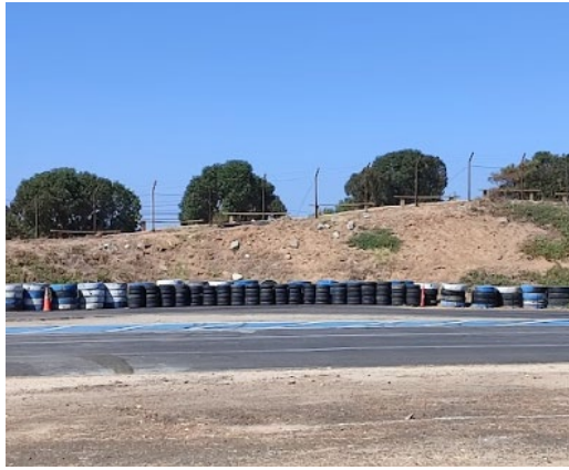
Vista desde la pista hacia la calle Anita Lizana