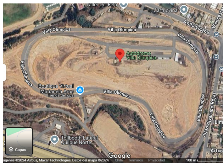
Figura N°1: Ubicación del proyecto (Google Earth 16/10/24 1 )