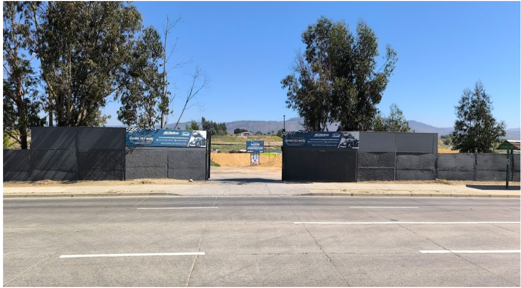
Instalación de barrera acústica en el portón de acceso principal del CADQ