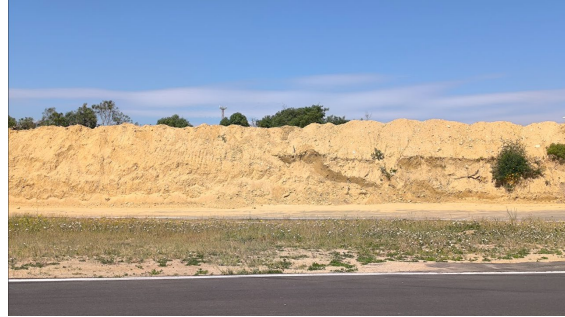
Aumento de la altura del talud hacia calle Juan Alvarado Rojas