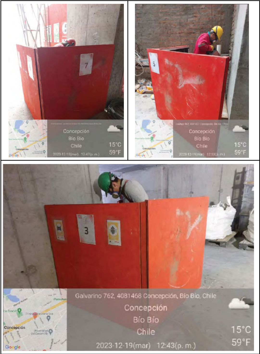
Figura 2: Fotografías aportadas por el titular en el PDC sobre los biombos instalados.

diferente numeración, lo que permite entender que el infractor no cumplió con la cantidad de biombos comprometidos. Esto se puede apreciar en las fotografías entregadas por el titular (Fig. 2).