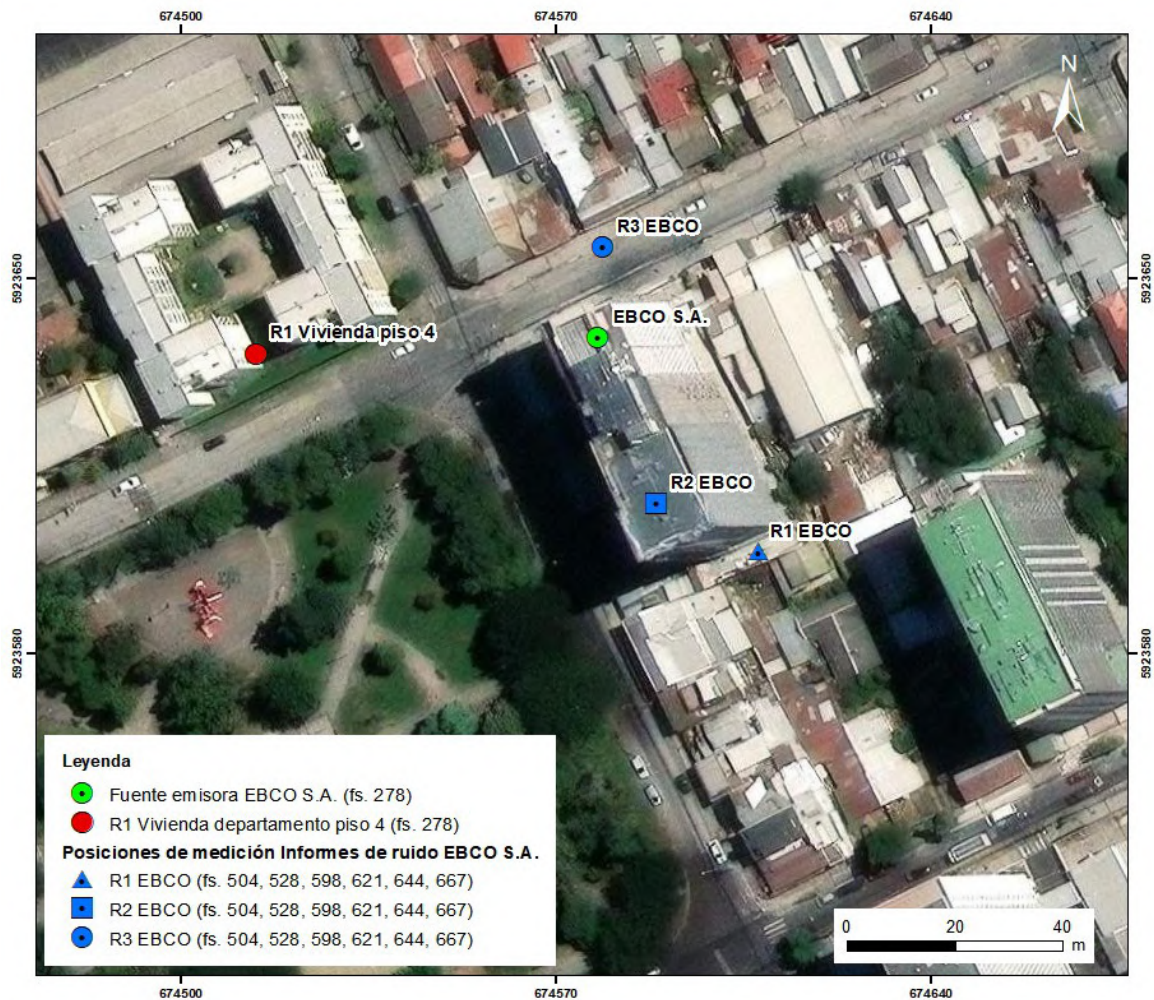
Figura 3: Ubicación de la unidad fiscalizable “EBCO S.A”, el receptor de ruido “R-1” (denunciante, en marcador rojo) y los receptores R1, R2 y R3 del monitoreo de ruido (en marcadores azules). En marcador verde se observa la unidad fiscalizable; en marcador rojo, el domicilio del denunciante y los marcadores azules corresponden

VIGÉSIMO TERCERO. Sobre este punto, tras la revisión de los informes de monitoreo de ruido presentados por la empresa (fs. 494, 518, 588, 612, 635 y 658, que corresponden a septiembre, noviembre, diciembre de 2024, enero, febrero y marzo de 2024, respectivamente), se observó que los receptores medidos (R1, R2 y R3) no corresponden al receptor sensible donde se acreditó el incumplimiento de la norma. Además, en todas las mediciones se mantuvo la misma ubicación de los tres receptores medidos (mismas coordenadas). En la Fig. 3 se presenta la ubicación de los receptores monitoreados por EBCO, y la ubicación del receptor donde ocurrió el incumplimiento.