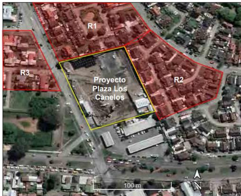
Figura 1 Esquema de ubicación de zonas receptoras