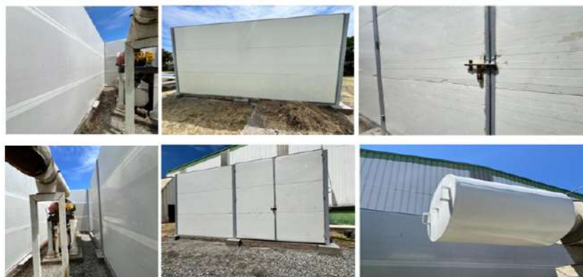
Imagen 6. Ubicación Soplador de Polvo de Terminación, Planta Mapal