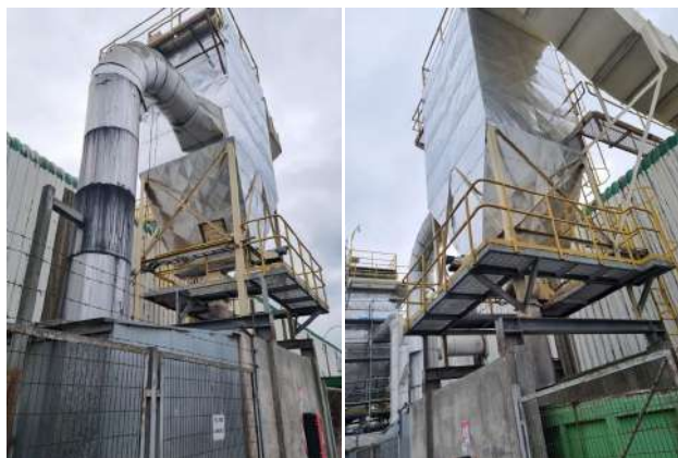
Imagen 3. Filtros de aire Línea 2 y 3 Melamina

14. A mayor abundamiento, y siempre en cumplimiento de lo ordenado por la Superintendencia, a continuación se acompañan fotografías de las principales fuentes generadoras de ruido de la Planta Mapal, así como el señalamiento de su ubicación.