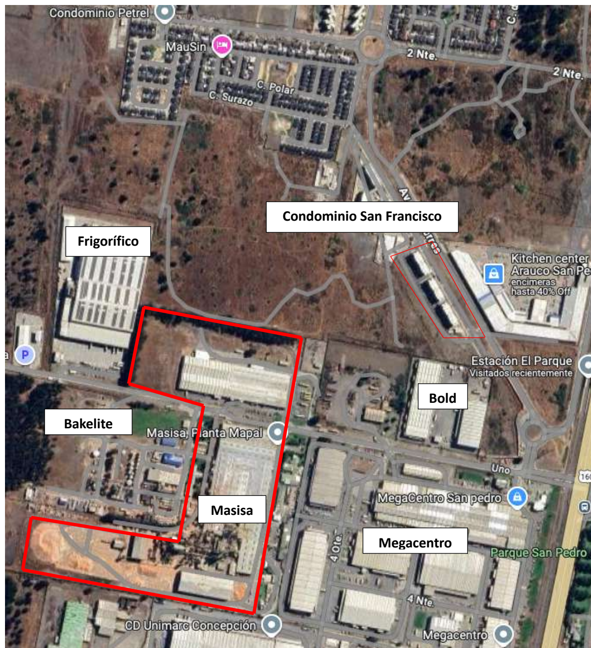
Imagen 1 Situación Planta Mapal