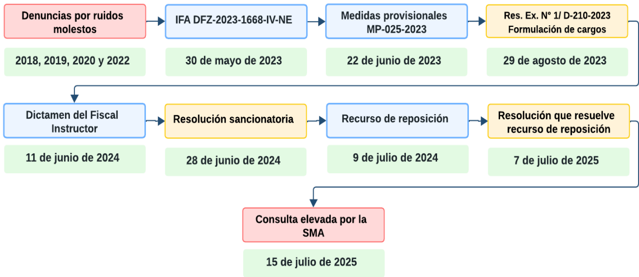
Figura 2. Línea temporal del procedimiento administrativo sancionador y de consulta ante el Primer Tribunal Ambiental.