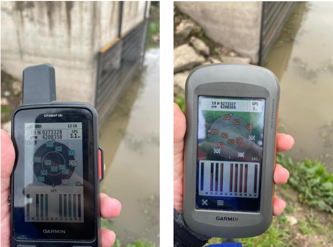
Figura 4. Medición de la cota a la que se ubican las obras, mediante la utilización de dos instrumentos GPS.

En el lugar, se constató mediante la utilización de un GPS modelo GPSMAP 66i marca Garmin y un GPS modelo Montana 650 marca Garmin, que la obra de captación y la canalización para la conducción de las aguas, se ubican en promedio a una cota de 100 m.s.n.m (se obtuvo un valor de 98 m.s.n.m con el primer instrumento y de 102 m.s.n.m con el segundo), la medición se obtuvo al costado sur de la obra de captación, lo que se observa en la Figura 4.