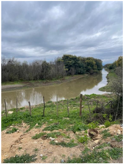
Figura 3. Canal de conducción.

En el lugar, se constató mediante la utilización de un GPS modelo GPSMAP 66i marca Garmin y un GPS modelo Montana 650 marca Garmin, que la obra de captación y la canalización para la conducción de las aguas, se ubican en promedio a una cota de 100 m.s.n.m (se obtuvo un valor de 98 m.s.n.m con el primer instrumento y de 102 m.s.n.m con el segundo), la medición se obtuvo al costado sur de la obra de captación, lo que se observa en la Figura 4.