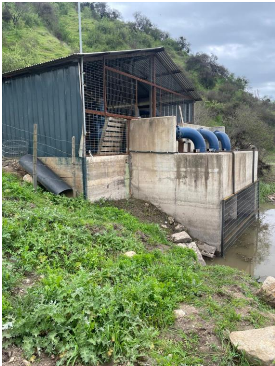
Figura 2. Captación mecánica.

Se visualizó en terreno que la obra de captación cuenta con 3 bombas, como se observa en la Figura 2.