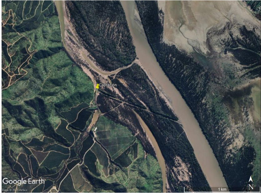
Figura 1. Ubicación de la obra de captación.

Se visualizó en terreno que la obra de captación cuenta con 3 bombas, como se observa en la Figura 2.