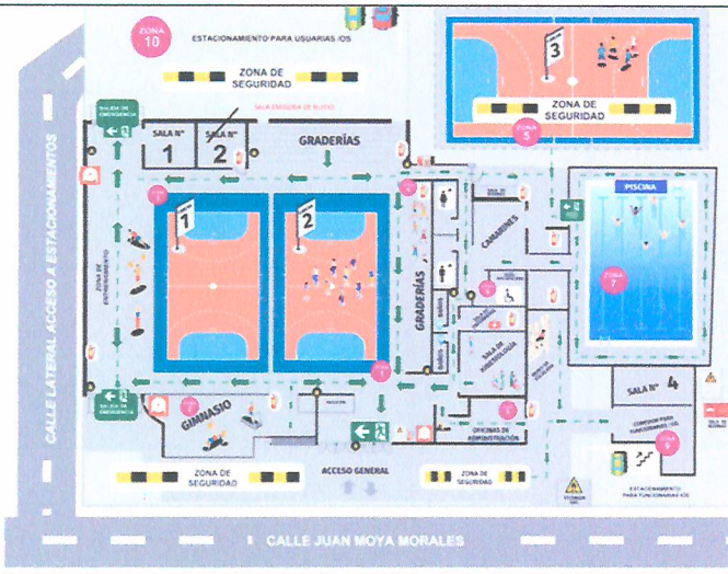
Se identifica el equipo y lugar emisor de ruido, sala 2 ubicada en orientación oriente.

Identifique el equipo, máquina o actividad que genera ruido. Acompañe un plano simple, indicando las dimensiones del establecimiento, y señalando la ubicación de el/los emisores de ruidos.