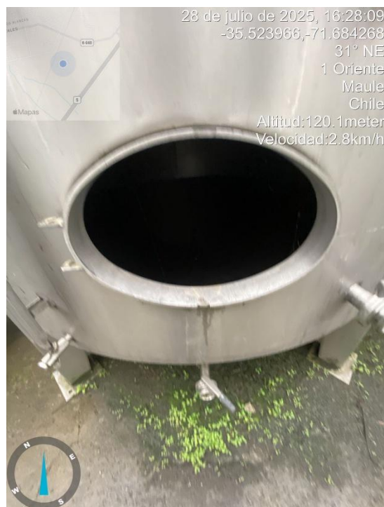
Figura 7 Evidencia de desmantelamiento de cubas en el Lote A5.