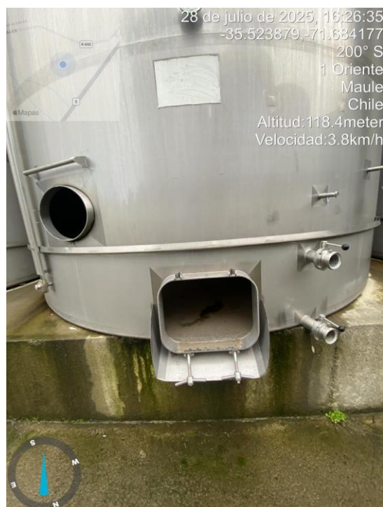
Figura 5 Evidencia cubas no utilizadas y su desmantelamiento en el Lote A5.