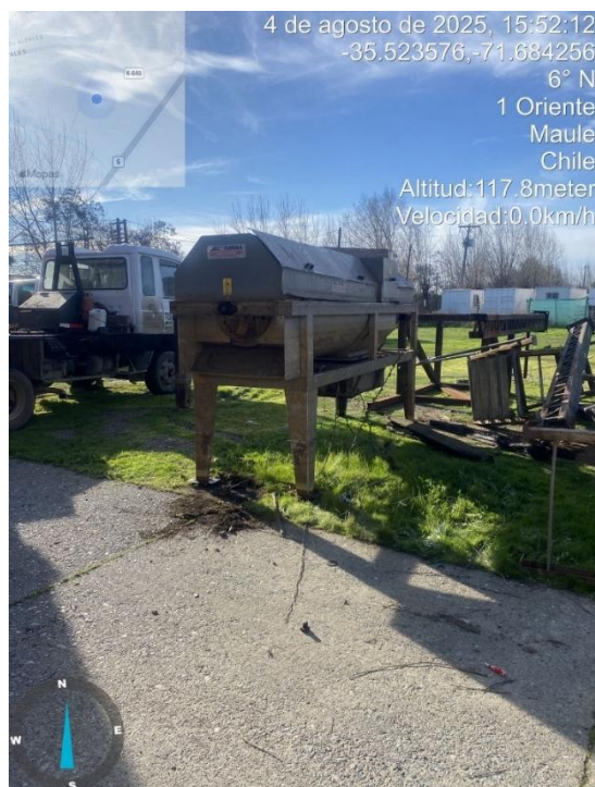
Figura 6 Retiro de las partes del proceso productivo en el Lote A5.