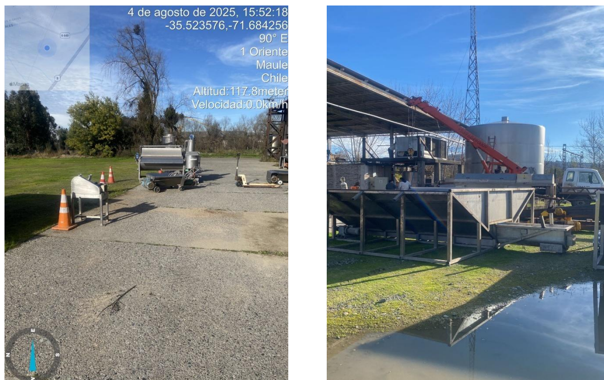
Figura 1 Fotografías de constancia de desmantelamiento.

Durante el período posterior a la notificación a la SMA, no se han observado nuevas descargas de RILes por parte del ocupante ilegal; las únicas actividades detectadas consistieron en el retiro esporádico de cajas de vino desde las instalaciones, sin evidencia de procesamiento ni de producción adicional. Este hecho fue verificado al lograr finalmente el acceso al sitio, constatándose que las maquinarias de procesamiento no operaban hace tiempo y que no existía actividad productiva reciente. (Véase Anexo B)