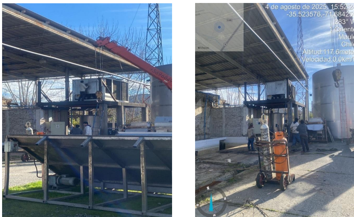
Figura 3 Situación actual del desmantelamiento en el Lote A5 de la subdivisión Viña Santa Delia.

Por lo tanto, la situación actual del predio corresponde a una planta en proceso de cierre definitivo, sin generación de nuevos residuos líquidos industriales y sin riesgo ambiental asociado, lo que será debidamente respaldado mediante todos los documentos y medios de verificación mencionados.