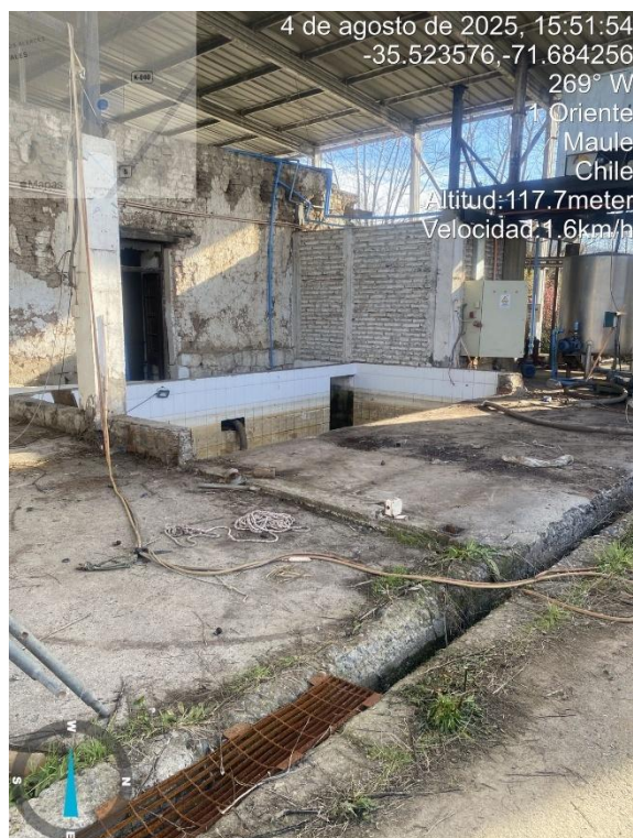
Figura 2 Fotografías estado actual de desmovilización de las obras.