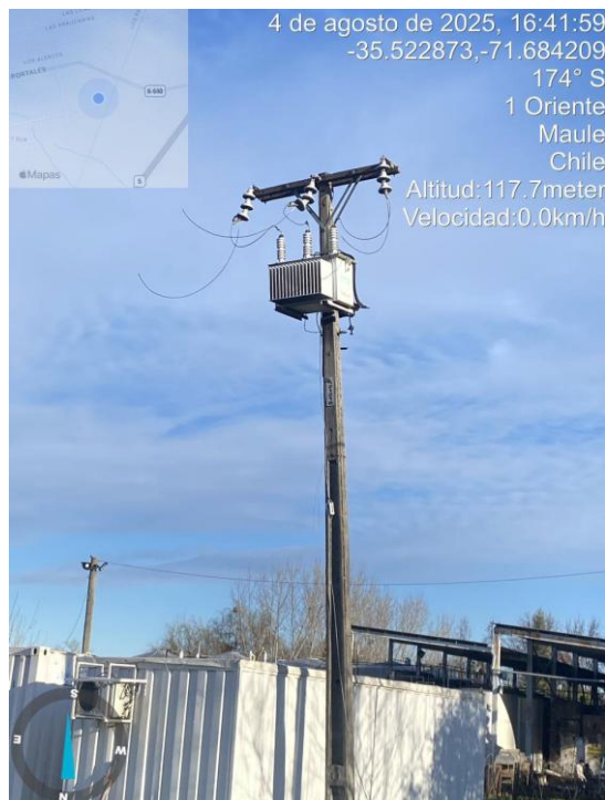
Figura 4 Retiro de las partes del proceso productivo y evidencia de corte del suministro eléctrico en el Lote A5.