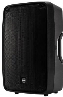
RCF HD 15A