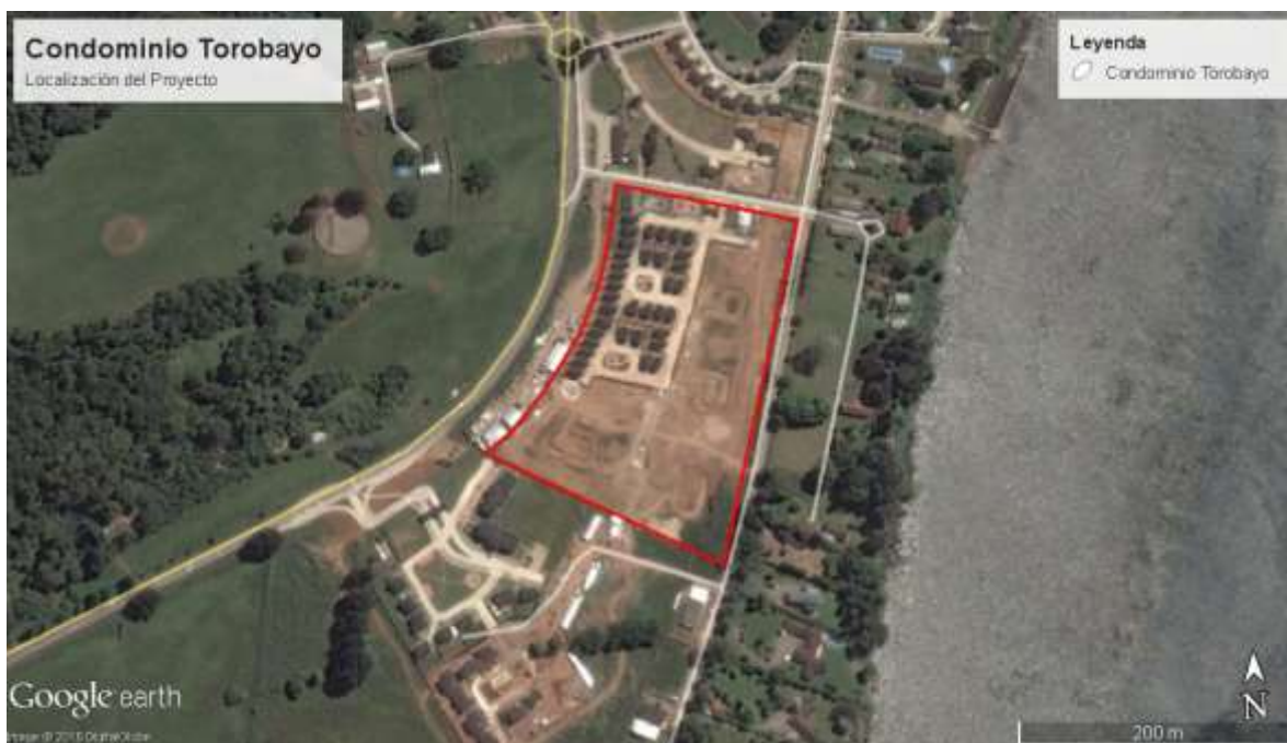
Figura 1 Localización del proyecto "Condominio Torobayo"

El proyecto "Condominio Torobayo" consiste en un proyecto inmobiliario localizado en la comuna de Valdivia, provincia de Valdivia, Región de Los Ríos. La siguiente figura muestra la representación gráfica de la localización del Proyecto.