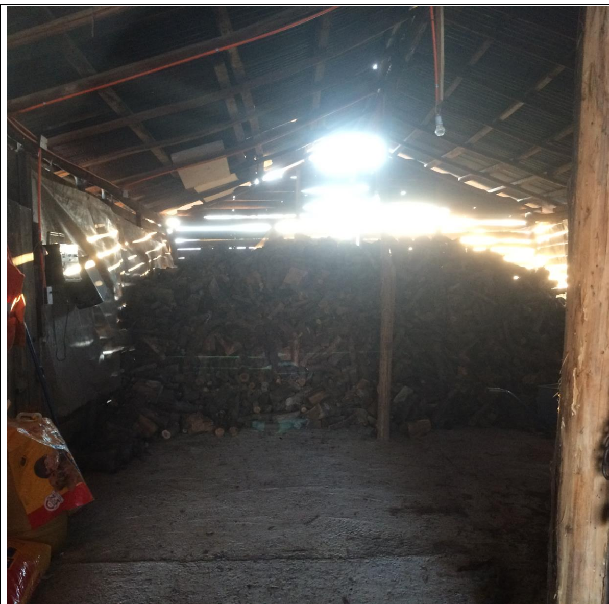
Imagen del almacenamiento de la leña.