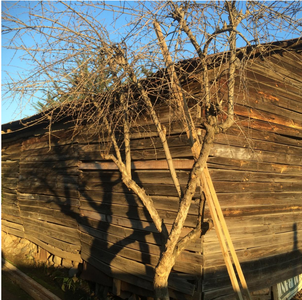
Imagen vista desde afuera de la bodega.