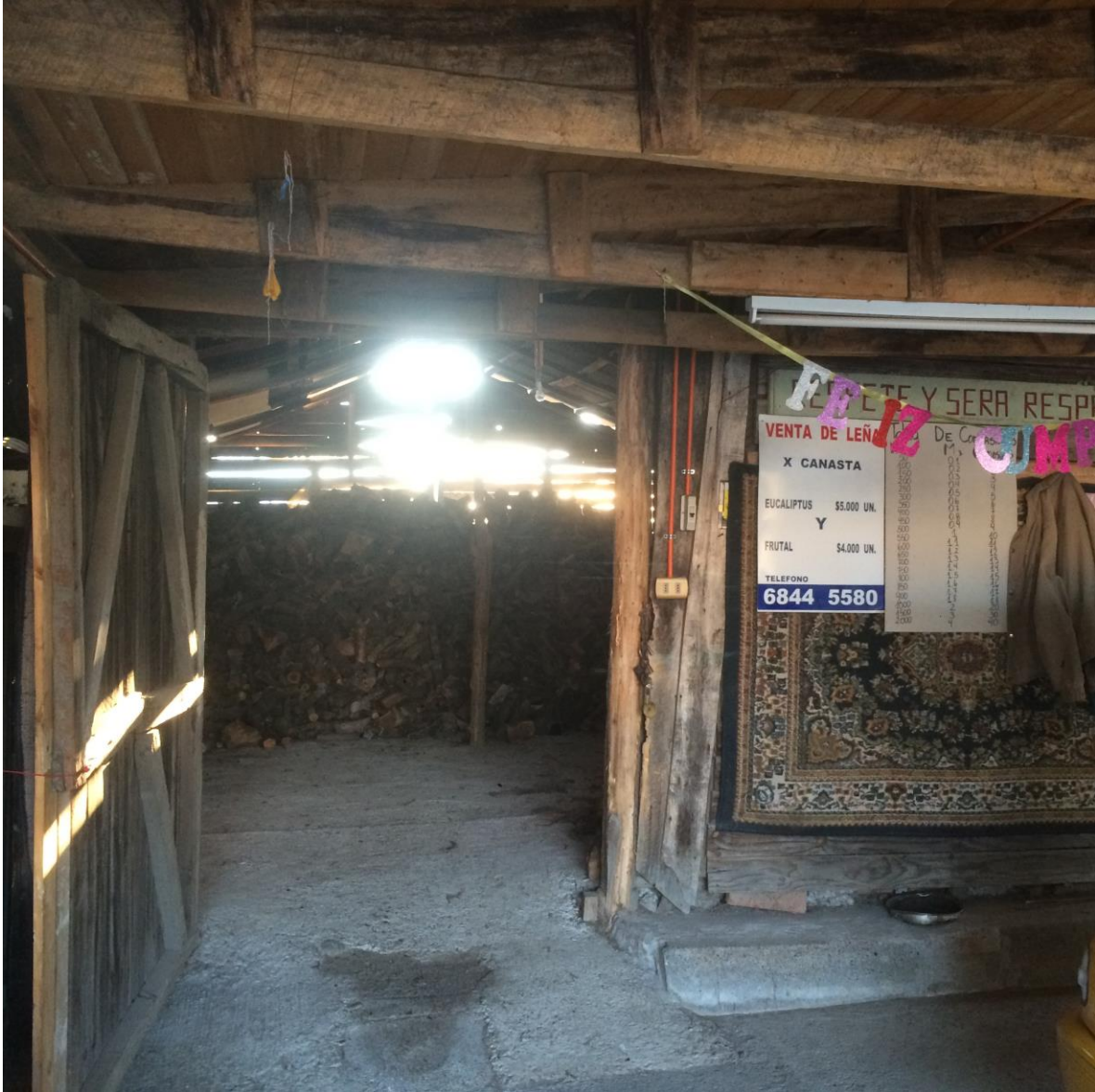
Entrada de la bodega