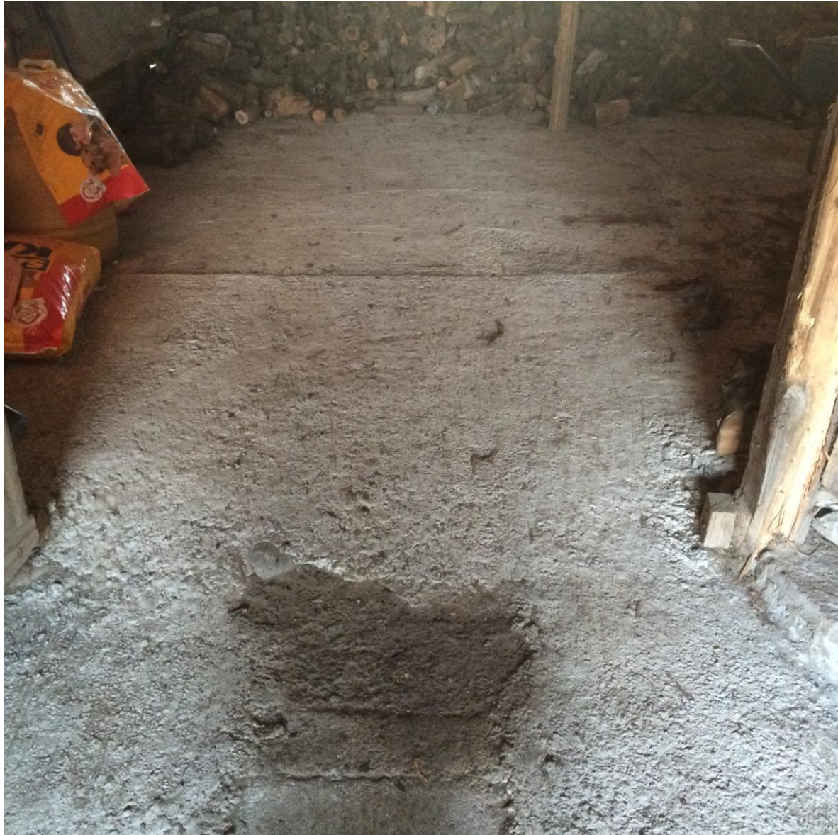
Suelo en cementado de la bodega