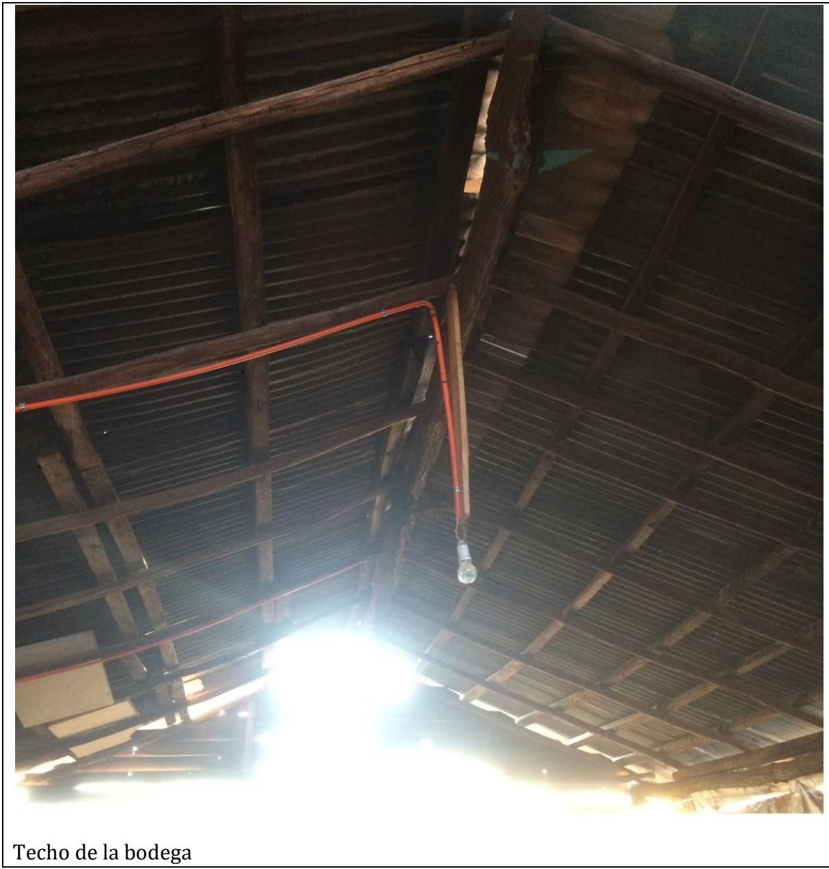
Techo de la bodega