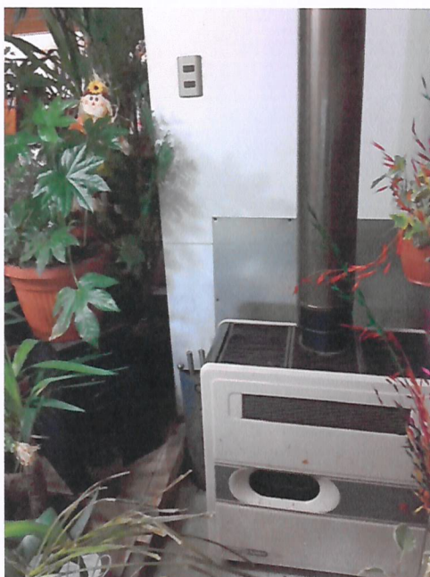
Calentador a Parafina Marca TENKI