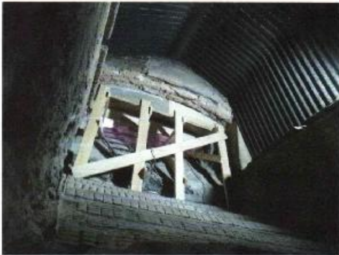
Moldaje soportante de estructura