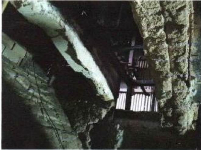
Retiro de estructura en mal estado