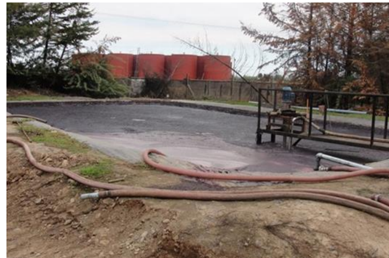
Fotografía de la Fiscalización Realizada

Esta actividad de habilitación del sistema de oxigenación fue realizada en el mes de Mayo de 2018, posterior a la fiscalización realizada.