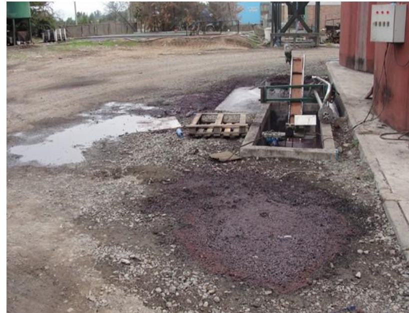
Fotografía de la Fiscalización Realizada

Se adjuntan registro fotográfico del equipo instalado sobre nivel, para no repetir los problemas presentados, de anegamiento del pozo y del equipo.