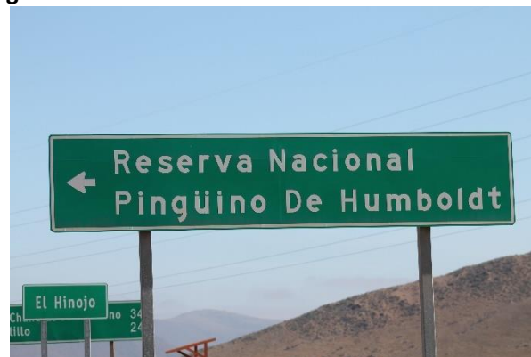
Fotografía 1. Señalética en Ruta C-500 con cruce Ruta C-496

Por otra parte, los visitantes acceden a estos atractivos turísticos a través de la Ruta C-500, la cual tiene instalada señalética alusiva a la ubicación y distancia de dichos atractivos, tal como se presenta a continuación: