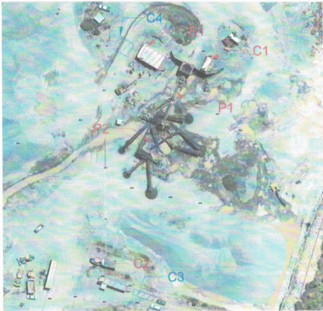
Figura 2: Planta de procesamiento de áridos