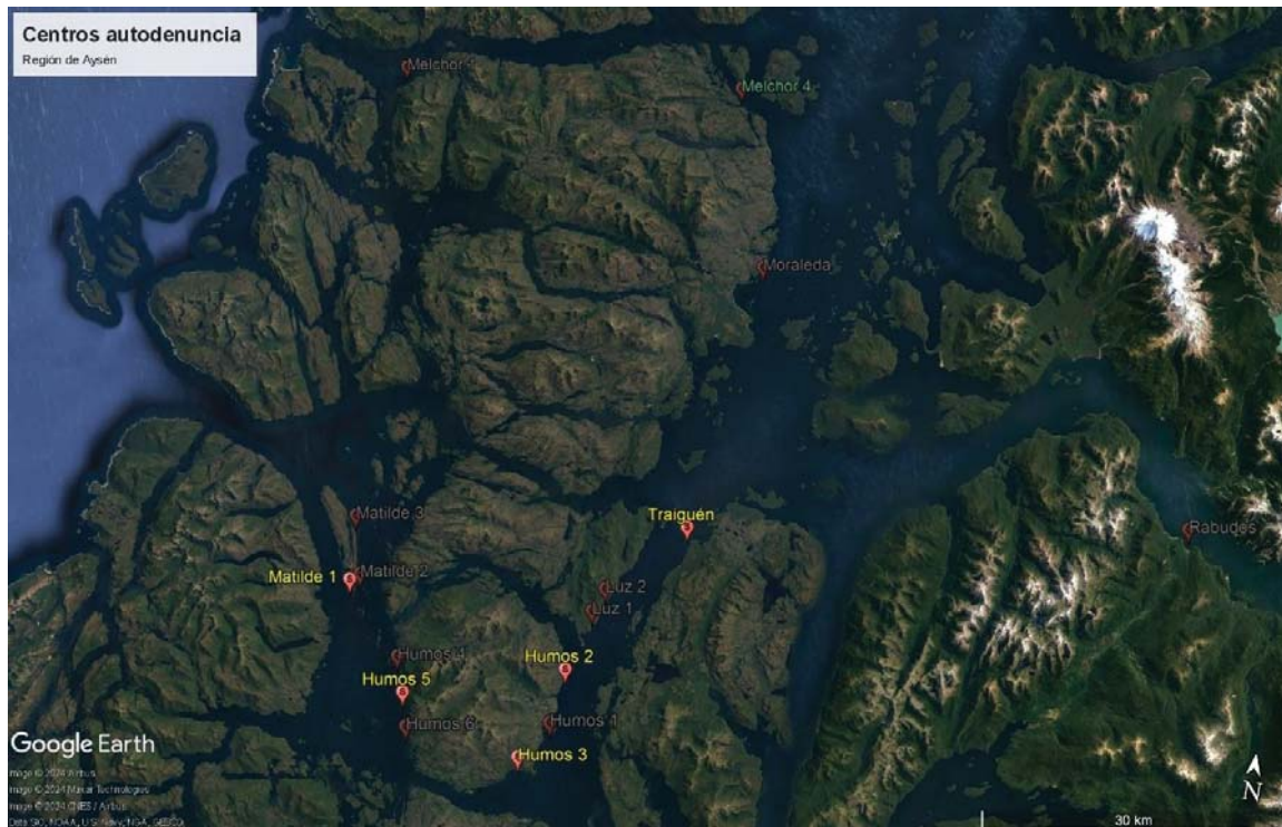
Figura 2. CES de la Autodenuncia que dejan de operar en la Región de Aysén (gris claro)