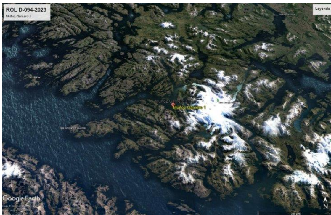
Figura 3: CES que deja de operar, Rol D-094-2023 (gris claro).

Ahora bien, en el caso concreto del presente Procedimiento Sancionatorio, el CES infractor se hace cargo de su propia sobreproducción, en su totalidad, según se ilustra en la siguiente figura: