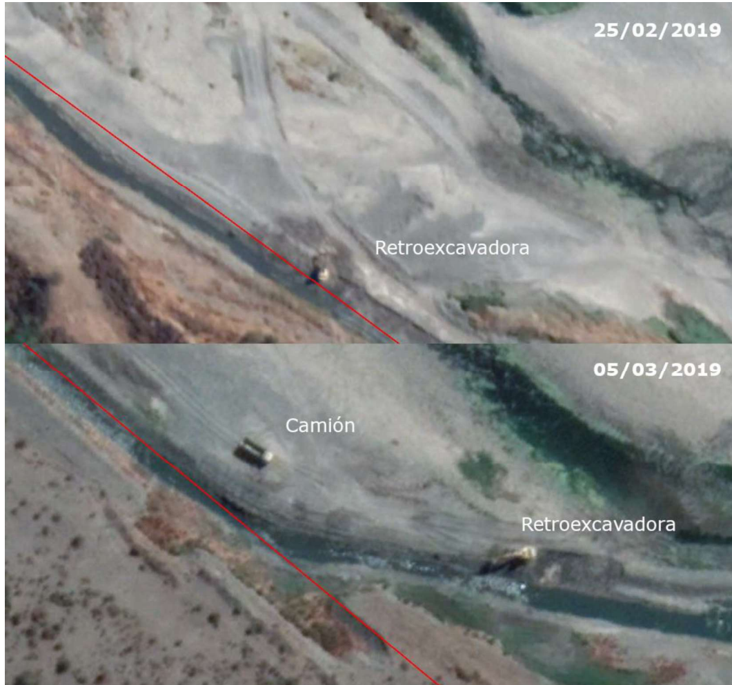
Imagen N° 4: Maquinaria en funcionamiento el 25 de febrero y el 5 de marzo de 2019 (fechas sin permisos vigentes)

Fuente: Elaboración propia en base al software Google Earth Pro. Coordenada referencial: Norte 6123265.00 m S; Este 293017.00 m . E. Datum: WGS84, Huso 19.