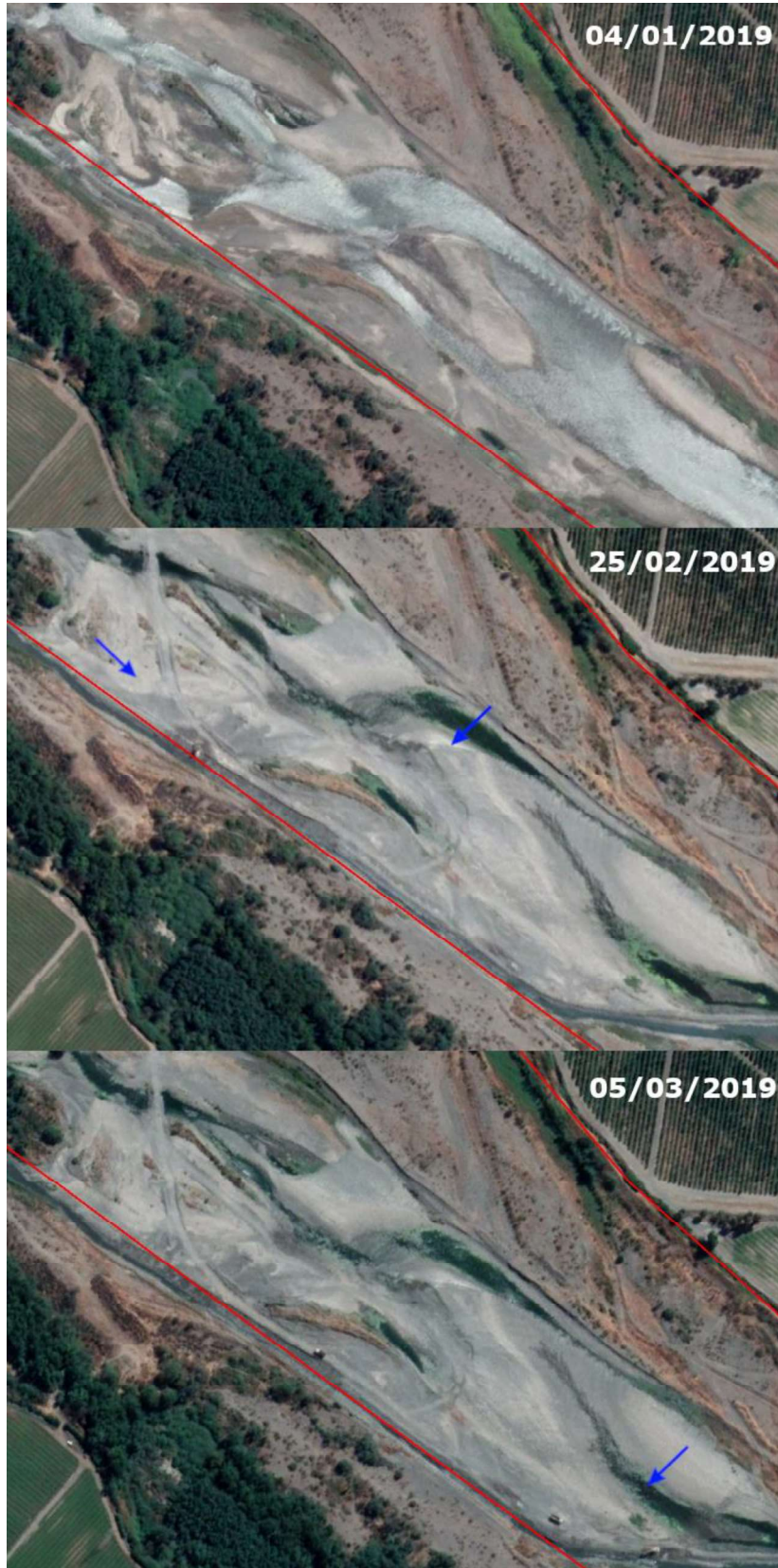
Imagen N° 3: Extracciones constatadas entre el 4 de enero y el 10 de mayo de 2019 (periodo sin permisos)

Coordenada referencial: Norte 6123265.00 m S; Este 293017.00 m . E. Datum: WGS84, Huso 19.