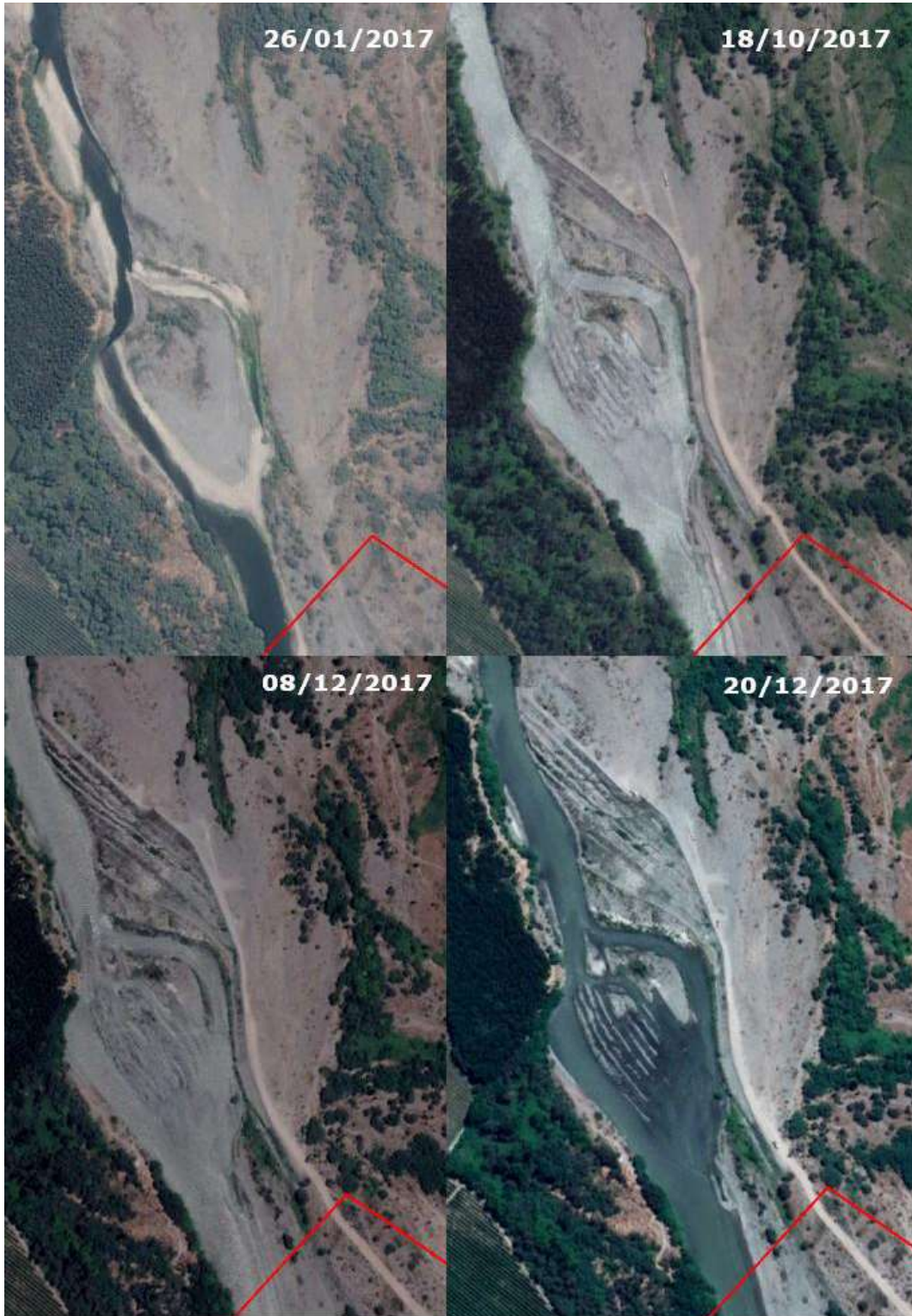
Imagen N° 6: Constatación de extracciones ejecutadas fuera del área autorizada por la RCA N° 207/2009 (en color rojo)

Coordenada referencial: Norte 6123265.00 m S; Este 293017.00 m. E. Datum: WGS84, Huso 19.