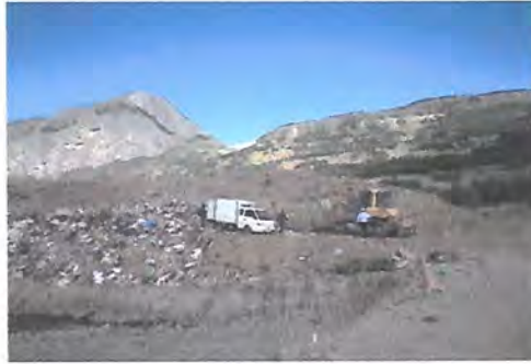
Frente de trabajo