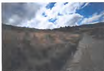
Pendientes de escorrentía superficial

Las secciones o instalaciones de control de escorrentía superficial son correctos requiriendo mejorar la señalización con el fin de efectuar un adecuado control post evento.