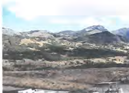
Vista del área confinada del relleno

sobrecarga de cobertura. Esta gruesa capa de tierra del tipo franco-arcilloso que se mantiene en algunos de los taludes se debe al exceso de cobertura colocado probablemente en momento de alta pluviometría. Las grietas que se observan son solo semi superficiales y obedecen a la pérdida de humedad ofreciendo una retracción de un suelo plástico dando origen a las denominadas grietas de retracción.