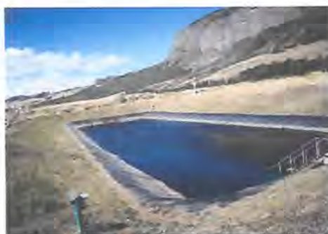
Almacenamiento de líquido percolado