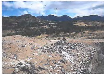
Bulldozer en operación