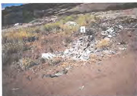
Punto señalado por ventilación vertical

La altura y forma de operación de este relleno sanitario hace difícil la concentración de lixigas o biogás en bolsas que puedan generar un riesgo, pues los taludes trabajan ventilando horizontalmente. Esta situación se puede detectar a simple vista al revisar las raíces de la vegetación espontanea afectada por anoxia.