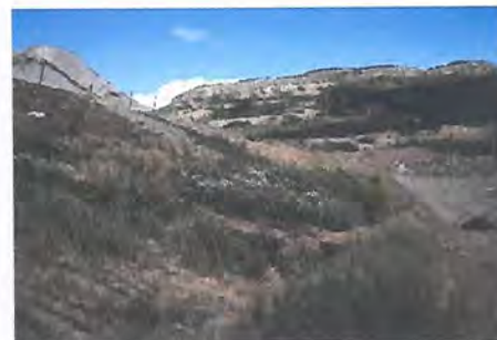
Taludes con sobre cobertura en exceso