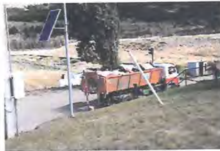
Báscula en acceso principal

Ingresando al relleno sanitario, acompañado del Titular del proyecto, observo las instalaciones, con una pesa de registro de ingreso.