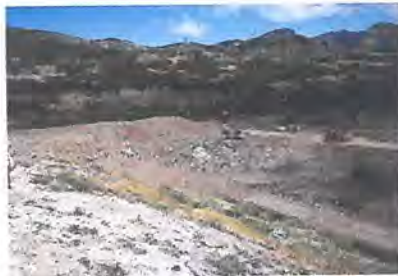
Acceso al frente de trabajo