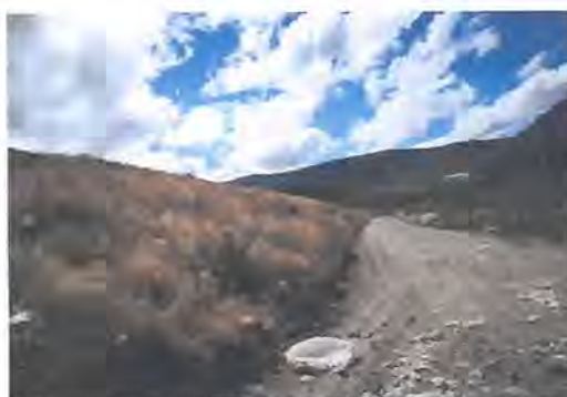
Taludes con presencia de vegetación con señales de anoxia

No hay que olvidar que los estudios de estabilidad normalmente se realizan en base a los principios y las técnicas que son propias de la geotecnia convencional, De acuerdo a la información disponible en la literatura técnica especializada, y en mi propia experiencia, los factores identificados que inciden en la estabilidad de los taludes de los rellenos domiciliarios, son - Geometría del Talud, que tiene directa relación con la altura y ángulo del talud, junto con la resistencia mecánica al corte del material que lo conforma y la condición de carga en el talud. De allí que el diseño geométrico FINAL adquiere relevancia en el diseño geométrico