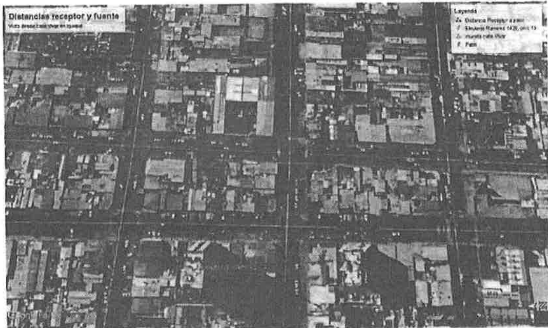
Figura N°1. Distancia entre receptor y patio del Liceo María Auxiliadora. Fuente y estimaciones. Google Earth*

45. En relación a las medidas y costos señalados anteriormente cabe indicar que, las medidas seleccionadas como las más idóneas fueron propuestas en base a las características de la fuente emisora, en este caso, provenientes principalmente del patio del liceo que colinda con la calle Vivar en Iquique, y el receptor sensible ubicado en el piso 19 de la calle Eleuterio Ramírez 1429, de la misma ciudad, cuya altura estimada 14 sería de 66,5 metros aproximadamente, y la distancia lineal entre el patio del liceo y la entrada del edificio del receptor, estimada en aproximadamente 85,6 metros. Luego, la distancia desde el patio al receptor, dada por la hipotenusa, es de 108 metros aproximadamente. La siguiente imagen N° 1 muestra la distancia lineal en plano entre el patio del liceo y el edificio del receptor.