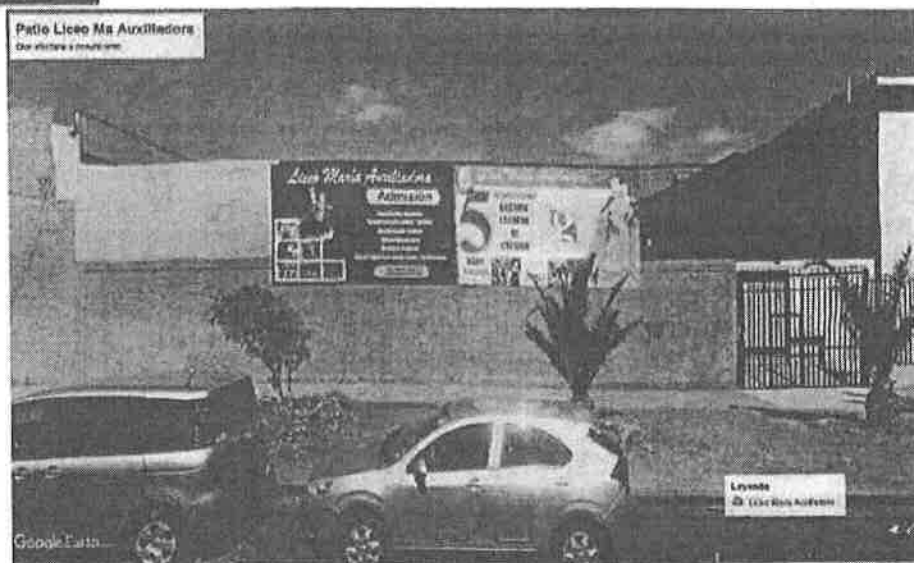
Figura N° 2. Muro que colinda con el patio del Liceo Maria Auxiliadora en calle Vivar.