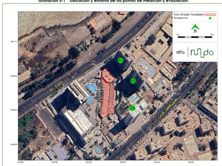
Ilustración 5-1 Ubicación y entorno de los puntos de medición y evaluación.