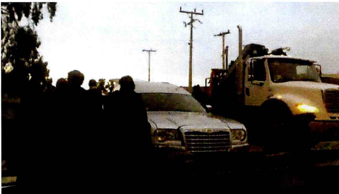
Imagen N° 3. Cortejo fúnebre en Cementerio de Los Vilos

Fuente: Informe “Evaluación del cumplimiento de los compromisos ambientales en el marco del EIA Proyecto LTE Cardones Polpaico / Tramo 3 / Comunas Canela (Huentelauquén) Los Vilos” elaborado por Preversalud Consultores.