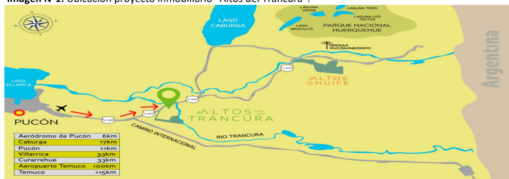
Imagen N°1: Ubicación proyecto inmobiliario "Altos del Trancura".