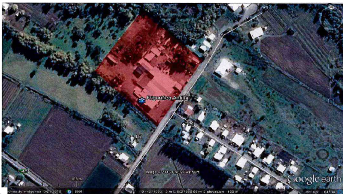
Figura 3: cercanía de la fuente emisora en relación con los receptores sensibles y la presencia de población circundante