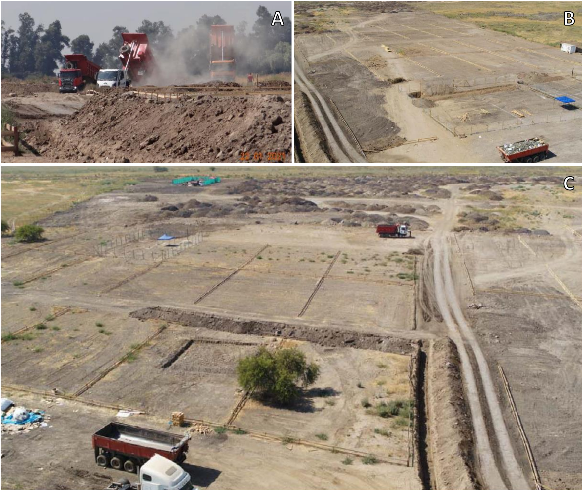
Figura 2. Actividades constatadas en inspección ambiental del 22 enero 2022

Nota: A) Fotografía 2, Anexo fotográfico (fojas 1189); B) Fotografía 3b (fojas 1190), Anexo Fotográfico; C) Fotografía 8b, Anexo Fotográfico (fojas 1194).