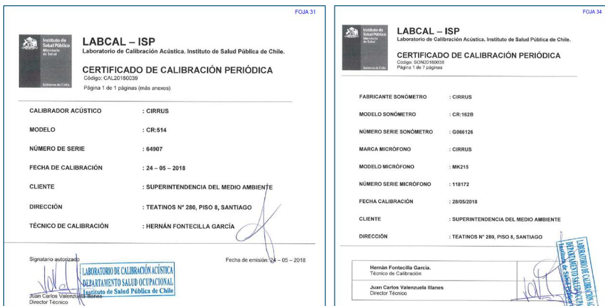
Figura N° 2: Certificados de calibración emitidos por el ISP