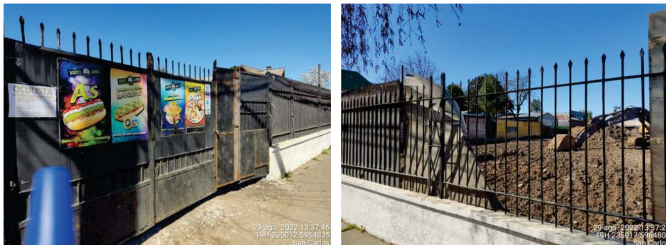
Fuente: Acta de notificación personal, 29 de agosto de 2022

5° Por último, cabe señalar que no se han recibido nuevas denuncias en contra de la referida unidad fiscalizable desde aquella inicialmente presentada el 22 de octubre de 2021.