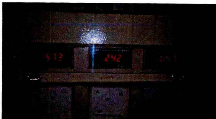
Imagen N° 1. Indicadores de temperatura del Horno secador de Agricob S.A. 4

68. La fotografía anterior, permite apreciar que la temperatura a la cual ingresa el aire al momento de la toma de la fotografía se encontraba a 242°C, valor que se encuentra entre 200° y 300°C. Asimismo, la empresa señala que el hogar del quemador funciona entre 450-650°C como promedio dependiendo si es verano o invierno.