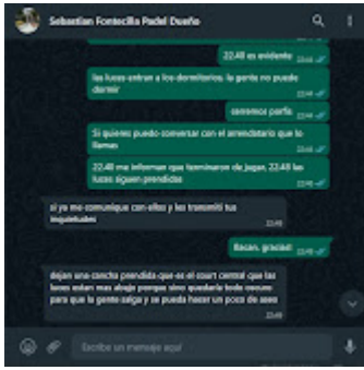
Screenshot 01. 27.06.2023.jpg 103K