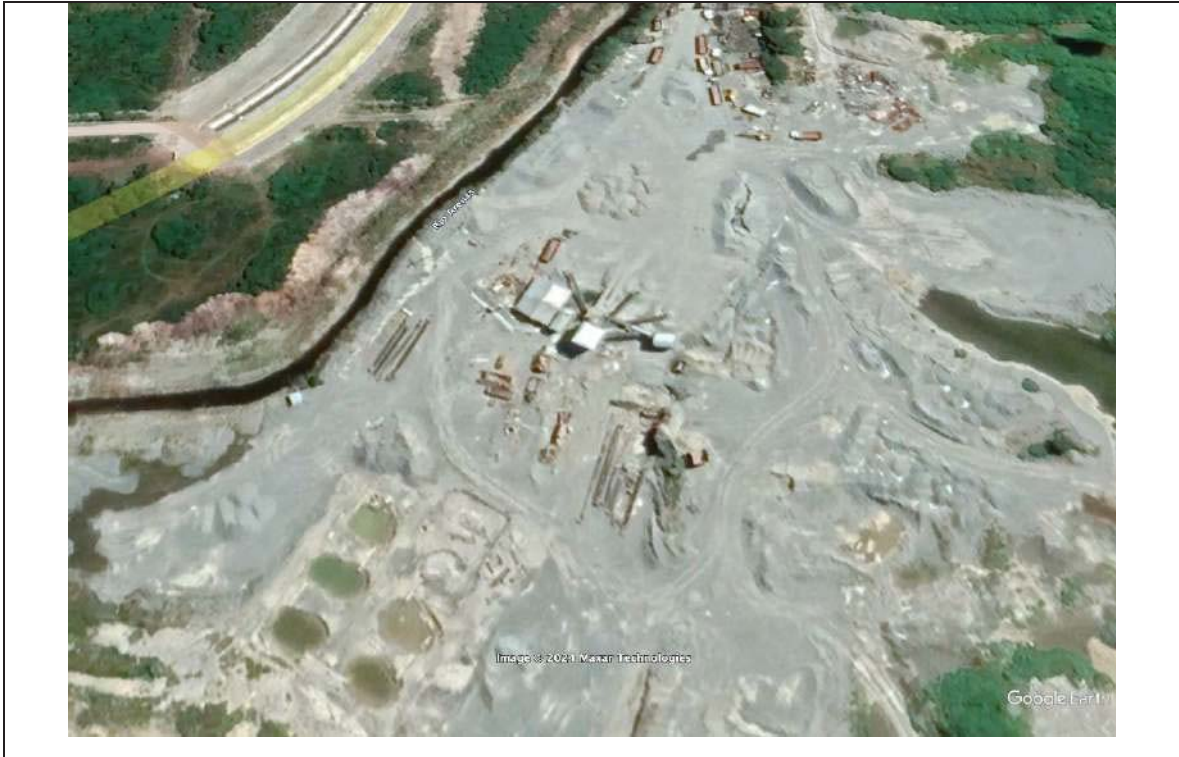
Figura 1: Imagen satelital, septiembre 2019 y febrero 2021

A fin de acreditar que la planta dejó de operar, documentos fidedignos al respecto, para acreditar la disminución de consumo eléctrico, que se resume a continuación.