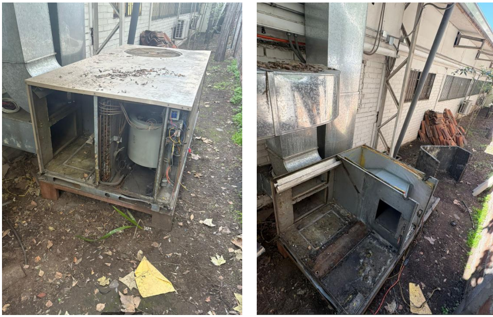
Figura N°5 y N°6: Proceso de desarme de aire acondicionado N°2 (segunda unidad)

21. Por otro lado, si bien se dará debida cuenta a la SMA en el informe del PDC, se hace presente que ya comenzó el proceso de desarme del aire acondicionado N°2, para luego proceder a sellarlo de la forma comprometida.