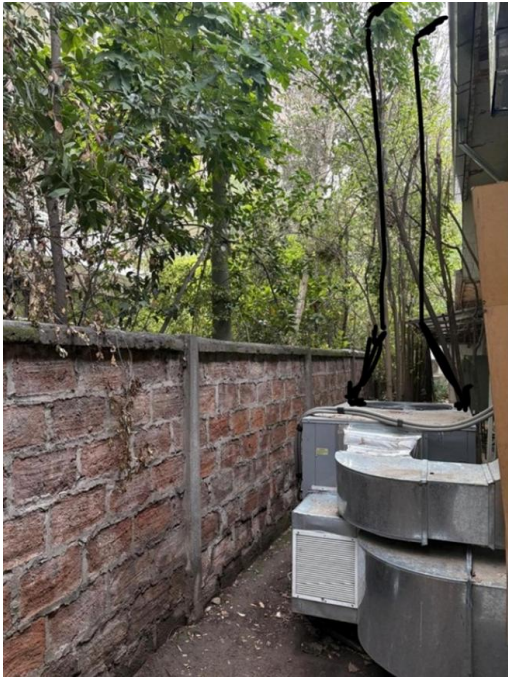
Figura N°3: Medida para Aire acondicionado N°1 (primera unidad)