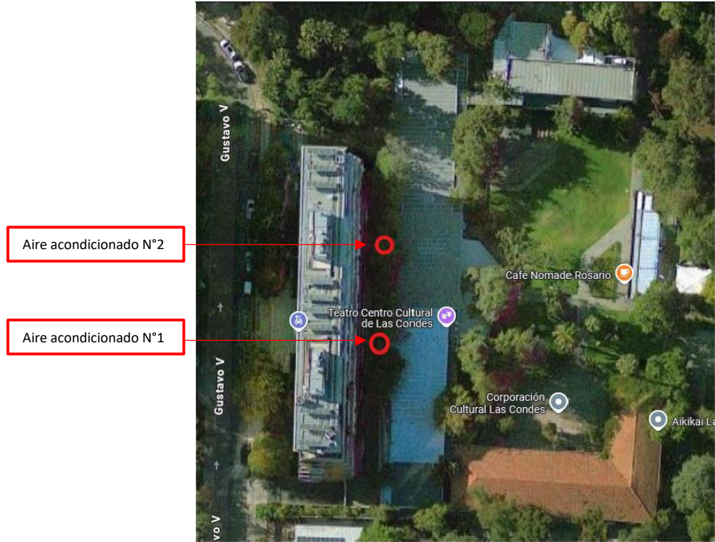
Figura N°1: Identificación de Teatro y aires acondicionados