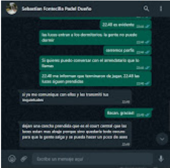
Screenshot 01. 27.06.2023.jpg 103K