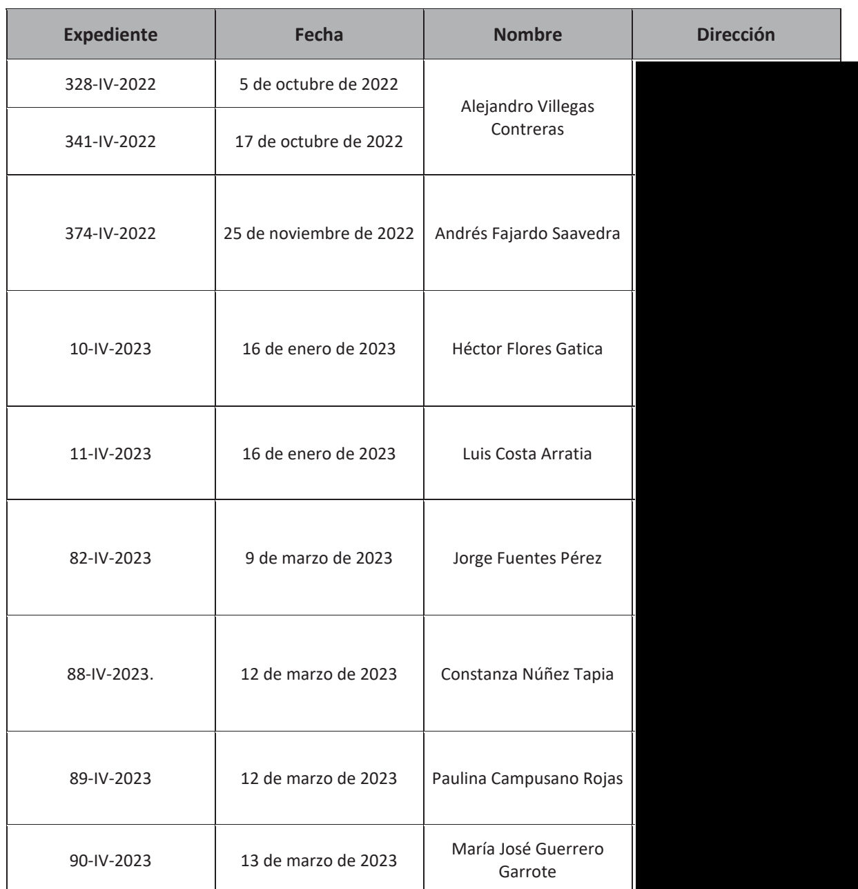
Tabla N°1: Nuevas denuncia

5. Que, por otro lado, se consideraron nuevas denuncias en contra de la unidad fiscalizable por medio del sistema digital de la SMA, las cuales se singularizan a continuación: